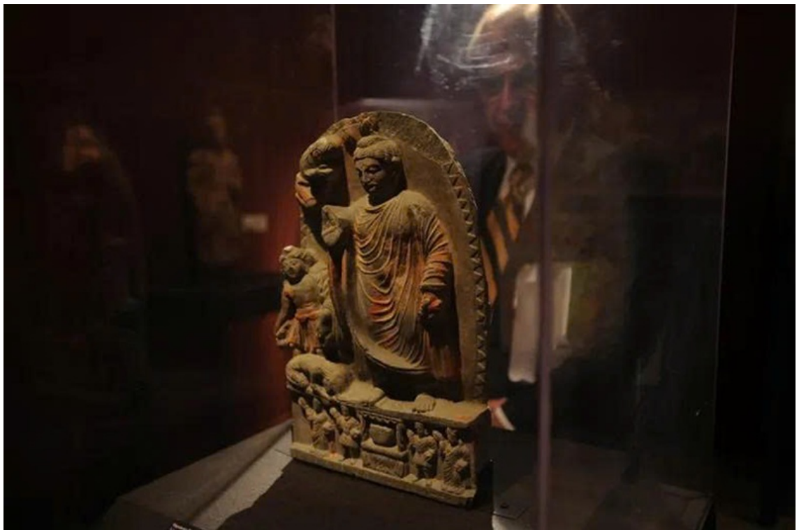
Cấu trúc kiến trúc được khai quật tại khu tầng xá (nơi ở của tầng sĩ) ở Mes Aynak.

Lịch sử Phật giáo tại Afghanistan từ sau thế kỷ XI đến nay không còn là biên niên sử của một tôn giáo sống, khi những cộng đồng Phật tử bản địa đã hoàn toàn tan biến vào cát bụi thời gian. Trang sử ấy đã chuyển mình thành một khúc ca bi tráng về sự suy tàn tuyệt đối dưới những cuộc viễn chinh đẫm máu, trải qua nửa thiên niên kỷ bị lãng quên trong hoang vu, để rồi khép lại bằng một cuộc chiến bảo tồn di sản đầy kịch tính và nghẹt thở giữa thế kỷ XXI.