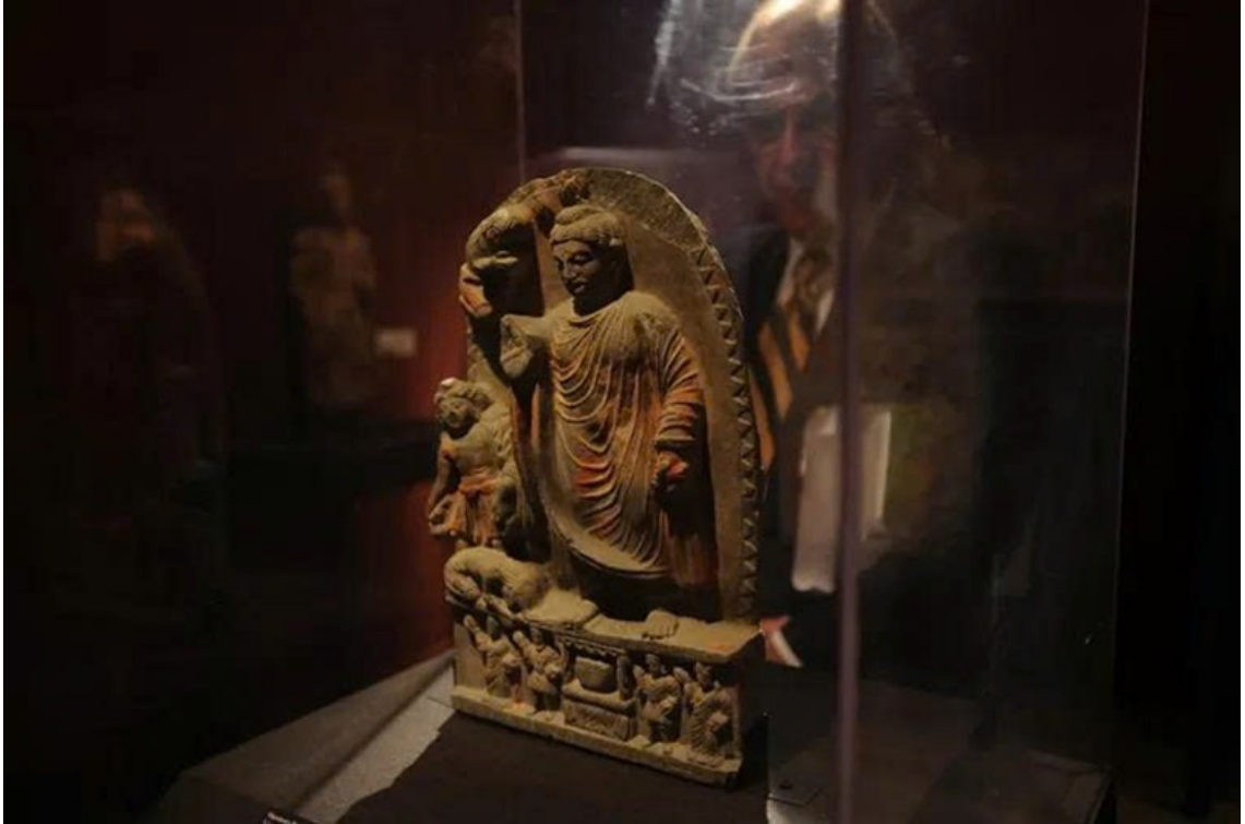
Cấu trúc kiến trúc được khai quật tại khu tầng xá (nơi ở của tăng sĩ) ở Mes Aynak.

kỳ công vào vách núi đá - những kỳ quan nhân loại sau này đã bị Taliban phá hủy một cách tàn nhẫn vào năm 2001. Trong lòng thung lũng đá ấy, người ta tin rằng đã từng có đến 5.000 hành giả ngày đêm tĩnh tọa tu hành trong các thạch động tịch mịch. Dấu dòng chảy thời gian và ngọn lửa bạo tàn của các thế lực cực đoan đã vùi lấp đi bao kiệt tác mỹ thuật quý báu, những tàn tích tự viện, bảo tháp, cùng các pháp khí và xá-lợi thiêng liêng vẫn âm thầm thức giấc, tiếp tục phát lộ dưới lòng đất Afghanistan. Khúc quanh định mệnh ập đến vào thế kỷ VII khi các cuộc viễn chinh Hồi giáo tràn qua, đìu đạo Phật vào làn sóng suy thoái, để rồi đến thế kỷ XI, tiếng chuông chánh pháp hoàn toàn tắt lịm trên mảnh đất Trung Á này.