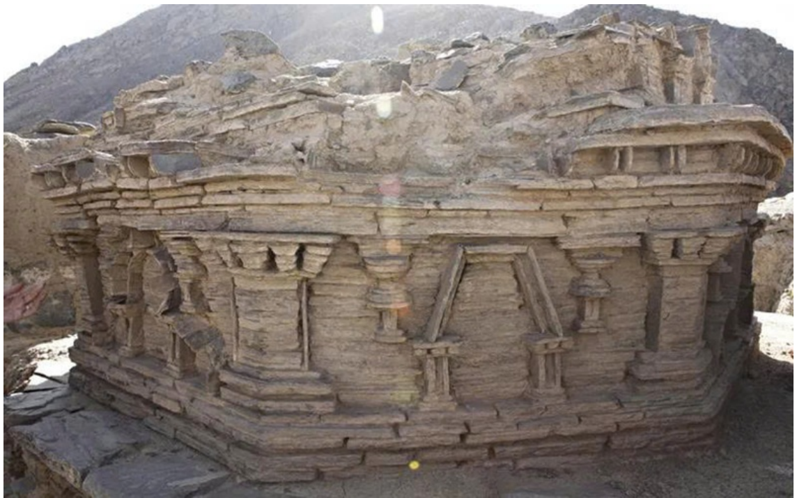
Tháp Bà-sa (stupa) chứa thánh tích tại tu viện Kafiriak thuộc di chỉ Mes Aynak. Tám bia đá mới được tìm thấy ngay cạnh công trình này.

Thuở ban đầu, mạch nguồn Phật giáo Nguyên thủy dường như đã đặt dấu chân tiên phong tại vùng đất này, thế nhưng dòng chảy Đại thừa mới là tông phong vươn lên giữ ngôi vị chủ lưu về sau.