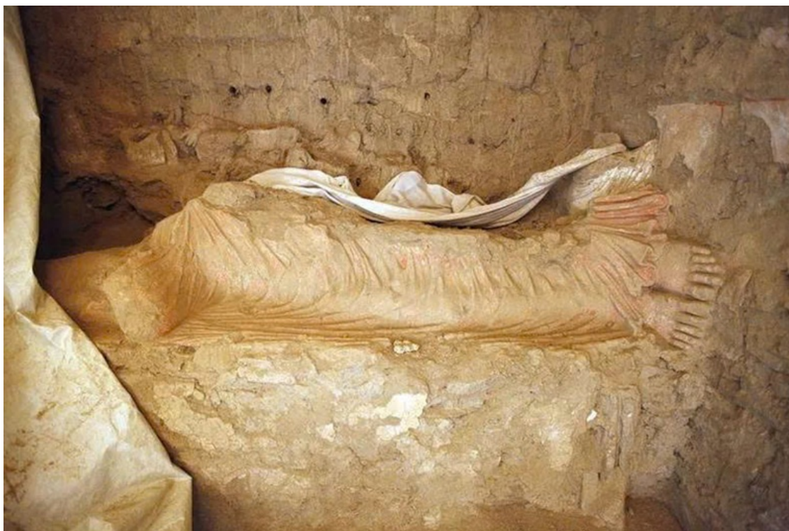
Tượng Phật nhập Niết-bàn tại tu viện Tepe Kafiriat (Afghanistan), nổi bật với hai bàn chân còn nguyên vẹn, minh chứng cho nghệ thuật điêu khắc cổ đại đặc sắc.

Khép lại những chương sử chiến chinh, giới sử học đều đồng thuận rằng, ngay sau Đại hội kết tập kinh điển lần thứ III vào thế kỷ III trước Tây lịch, một mạch nguồn tâm linh tĩnh lặng đã chạm đến vùng đất kiêu hùng này. Hoàng đế Ashoka - bậc đại hộ pháp tối cao của lịch sử Phật giáo - đã long trọng ban sắc chỉ, phái đoàn Sứ giả Như Lai lên đường hành đạo. Sứ mệnh thiêng liêng của họ là mang ngọn đuốc từ bi và trí tuệ nhiệm mầu của đạo Phật xuyên qua các biên giới hiểm trở, thắp sáng mảnh đất Afghanistan, đặt nền móng cho một kỷ nguyên dung hợp văn hóa Đông - Tây rực rỡ ngàn năm.