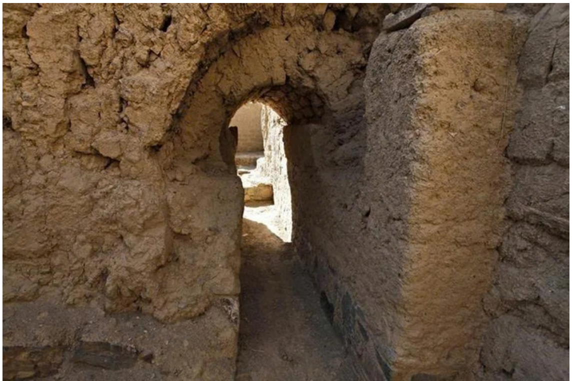
Hành lang tu viện Tepe Kafiriat, Afghanistan, thuộc khu khảo cổ thời kỳ Đế quốc Kushan.

Di sản Con đường Tơ lụa: Từng là hồng tâm của tuyến lộ huyền thoại, nền văn hóa nơi đây là sự giao thoa rực rỡ giữa các nền văn minh Ba Tư (Iran cổ đại), Ấn Độ, Hy Lạp và Trung Cổ. Những phiến thảm thủ công tinh xảo, những vần thơ bất hủ, và trò chơi cưỡi ngựa giật dê (Buzkashi) cuồng nhiệt chính là chứng nhân cho một thời hoàng kim.