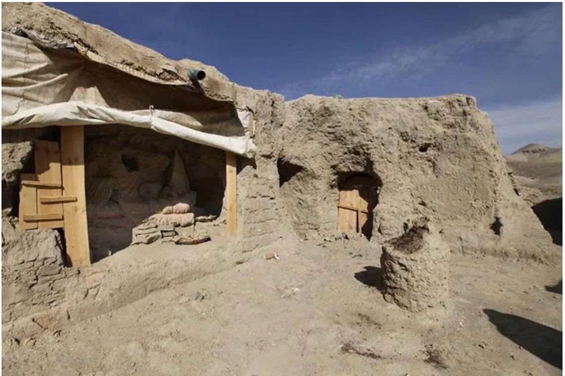
Khu sân trung tâm thuộc phế tích tu viện Kafiriāt tại Mes Aynak đang được khảo cổ.

Ngay tại hồng tâm của trục tọa độ tâm linh vĩ đại đó, vương quốc cổ đại Gandhāra, ôm trọn cả phần lãnh thổ Afghanistan hiểm trở ngày nay, chính là viên ngọc quý tỏa chiếu thứ ánh sáng rực rỡ nhất của nền văn minh và mỹ thuật Phật giáo toàn cầu.