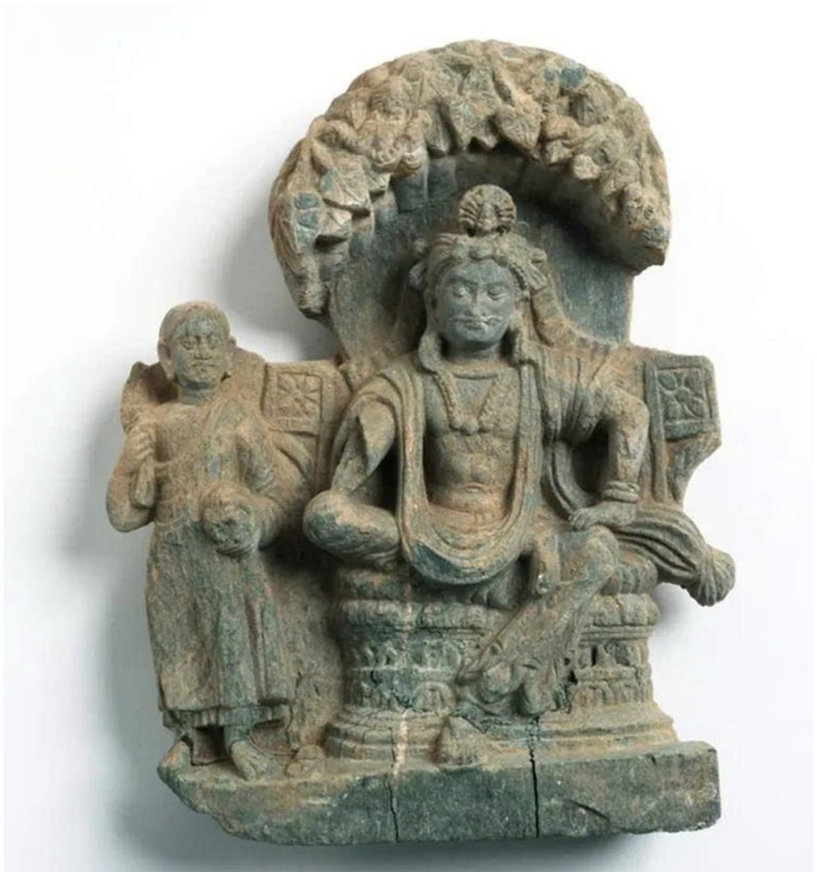
Tấm phù điêu khắc đá hơn 1.600 năm tuổi họa hình Thái tử Siddhartha Gautama và một tăng sĩ, mới được phát hiện tại cổ thành Mes Aynak, Afghanistan.

Bản hòa ca đa sắc tộc: Khắp bờ cõi là sự hội tụ của những bộ tộc kiêu hùng, từ người Pashtun dũng mãnh thống lĩnh phía nam và phía đông, người Tajik, người Uzbek, cho đến người Hazara kiên cường ẩn mình nơi vùng núi trung tâm hoang vu.