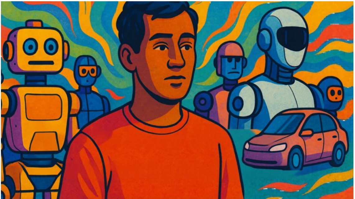
Hình mang tính minh họa.

Khi AI ngày càng tinh vi trong việc phân tích hành vi và sở thích người dùng, mức độ cá nhân hóa này sẽ còn mạnh mẽ hơn nữa. Nếu mạng xã hội từng là chất xúc tác cho chủ nghĩa cá nhân, thì AI có nguy cơ làm cho xu hướng ấy trở nên gây nghiện hơn gấp bội.