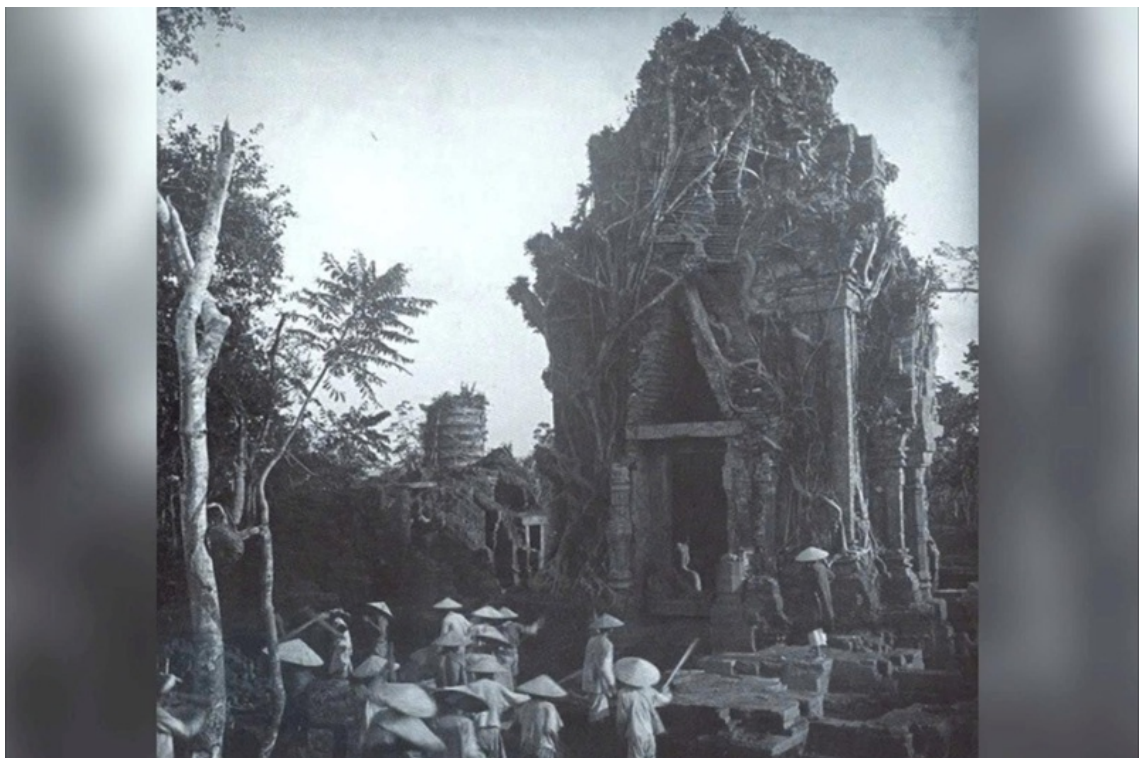
Phật viện Đồng Dương được khai quật năm 1902.

Nghiên cứu về Phật giáo Chăm Pa nói chung và Phật viện Đồng Dương nói riêng đã hình thành một nền tảng học thuật tương đối phong phú, trải dài từ các khảo cứu kinh điển đầu thế kỷ XX đến các tiếp cận liên ngành đương đại. Có thể phân loại các kết quả nghiên cứu thành ba hướng chính: (i) nghiên cứu lịch sử - khảo cổ; (ii) nghiên cứu nghệ thuật và biểu tượng; (iii) nghiên cứu tôn giáo - tư tưởng.