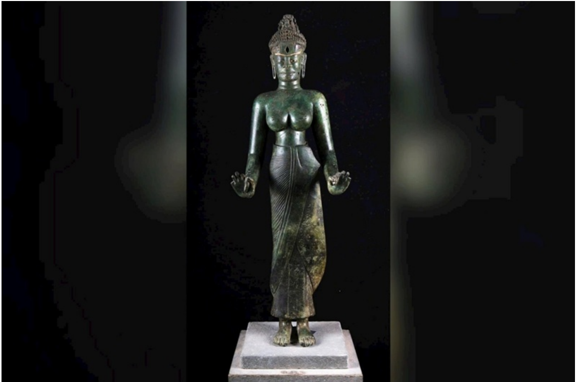
Bảo vật quốc gia tượng Bồ tát Tara có tuổi đời 1.200 năm tuổi được tìm thấy tại Phật viện Đồng Dương.

Cách tiếp cận này cho phép chuyển dịch trọng tâm từ “bảo tồn phế tích” sang “tái tạo ý nghĩa”, đặc biệt phù hợp với các di sản tôn giáo đã bị suy giảm về hình thái vật chất như Phật viện Đồng Dương.