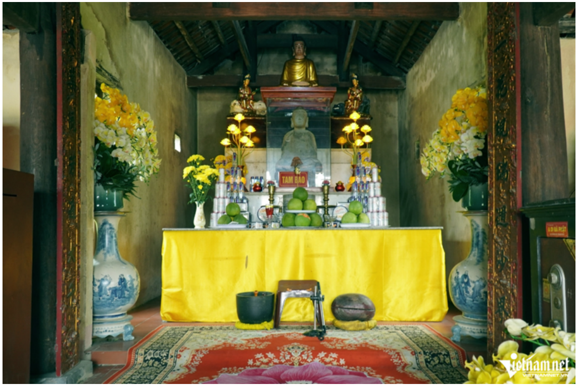
Bên trong chùa còn lưu giữ một tượng Phật cổ bằng đá.

Hiện nay, tại chùa Am Các có nhiều công trình kiến trúc tôn giáo như chùa Trình, chùa Hạ, chùa Trung, chùa Thượng và phủ Ngọc Sơn, cùng các địa điểm liên quan như khe Mỗ, mỏ đá, tảng đá khắc hình Phật và khu sản xuất gạch ngói cổ được cho là cùng khoảng niên đại.