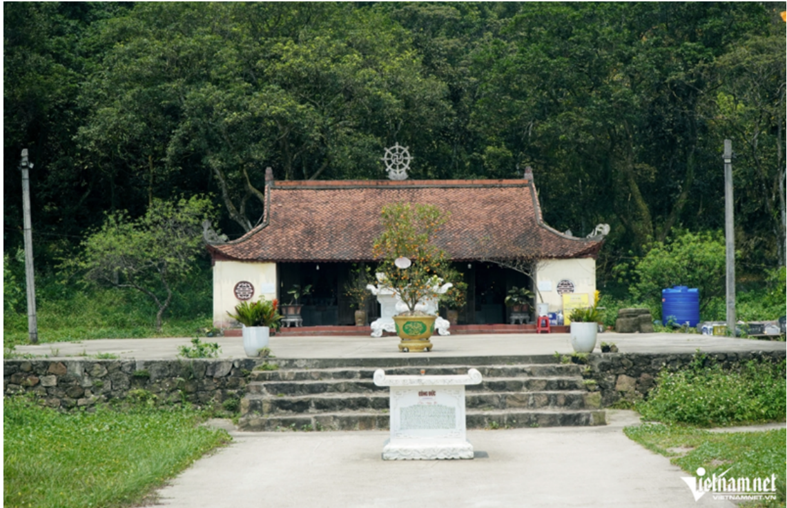
Chùa Am nằm trong quần thể chùa Am Cúc.

Ngoài ra, việc phát hiện khu lò nung gạch, ngói cổ đã giúp các nhà nghiên cứu có thêm cơ sở xác định niên đại và quá trình phát triển của chùa trong thời kỳ phong kiến. Từ năm 2018 đến 2023, qua các đợt thăm dò, khai quật khảo cổ, vẫn chưa có tài liệu xác định chính xác thời điểm ra đời của chùa. Tuy nhiên, các hiện vật cho thấy chùa được hình thành từ sớm, gắn với thời kỳ Đại Việt và sự phát triển của Phật giáo từ thế kỷ X. Nhiều di vật có niên đại từ thời Trần đến Lê Trung hưng.