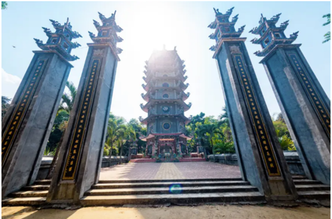
Tòa bửu tháp uy nghi trong khuôn viên chùa Thiên Ân.

Về kiến trúc, chùa Thiên Ân gây ấn tượng bởi những họa tiết cầu kỳ hình lưỡng long chầu nguyệt cùng cuốn thư và hệ thống câu đối được trang trí ngay cổng ra vào. Phía trên cánh cổng - gác tam quan được đặt bức tượng thần Hộ pháp bảo vệ chùa. Bước tiếp vào trong là hai dãy tượng La Hán ở hai bên những bức tượng Phật.