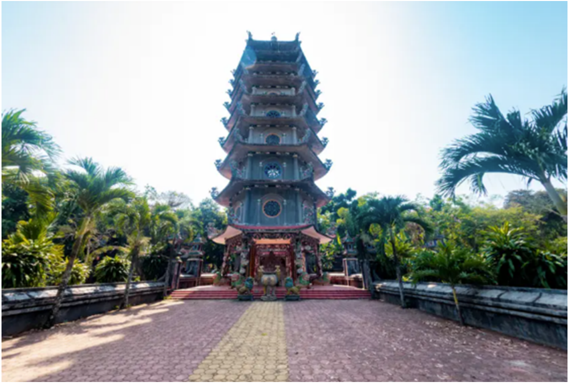
Tòa bửu tháp uy nghi trong khuôn viên chùa Thiên Ấn (Quảng Ngãi).

Chùa Thiên Ấn nằm uy nghi trên đỉnh núi Thiên Ấn, thuộc xã Tịnh Ấn, huyện Sơn Tịnh (cũ), tỉnh Quảng Ngãi. Đây là vị trí " tọa sơn hướng thủy ," một đặc điểm thường thấy trong kiến trúc chùa Việt Nam, mang ý nghĩa phong thủy tốt lành. Chùa không chỉ là một địa điểm linh thiêng của Phật giáo mà còn gây ấn tượng bởi vẻ đẹp thanh tịnh và cổ kính. Với bề dày lịch sử hơn 300 năm, nơi đây thu hút du khách bởi không gian yên bình, hài hòa giữa thiên nhiên và kiến trúc độc đáo. Đây cũng là một ngôi chùa xưa nhất và lớn nhất của Giáo hội Phật giáo Quảng Ngãi.