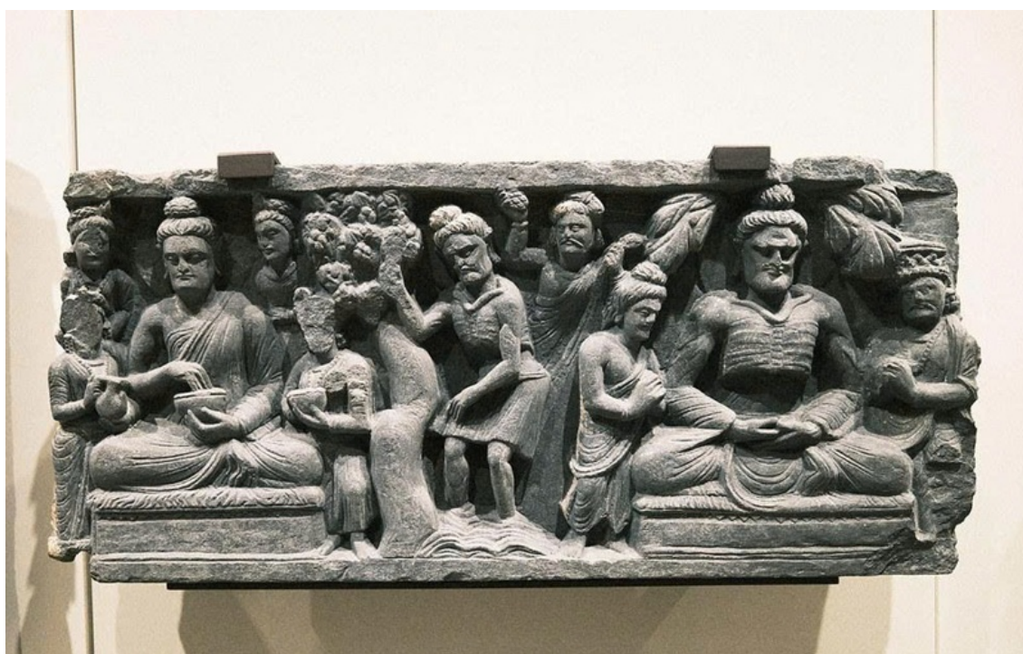
Cuộc đại khổ hạnh và việc tìm ra Con đường Trung đạo. Pakistan, Gandhara, thế kỷ II - III, đá phiến.

Nguyên lý Trung đạo gắn liền với một bước ngoặt quan trọng trong hành trình tìm đạo của Đức Phật Thích Ca Mâu Ni (Siddhartha Gautama), một nhân vật có thật trong lịch sử, nhà tư tưởng và là người sáng lập đạo Phật. Vốn sinh ra trong nhung lụa chốn hoàng cung, nhưng sau khi chứng kiến cảnh già nua, bệnh tật và cái chết, Ngài đã từ bỏ vinh hoa để dấn thân vào con đường ép xác khổ hạnh cùng cực nhằm tìm lối thoát khỏi những nỗi khổ niềm đau.