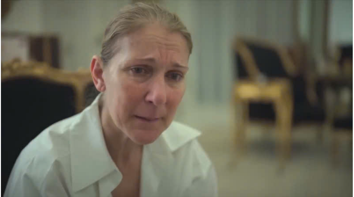
Céline Dion khi đang điều trị bệnh.

Năm 2022: Céline mắc hội chứng người cứng (Stiff Person Syndrome), ảnh hưởng nghiêm trọng đến khả năng ca hát và vận động.