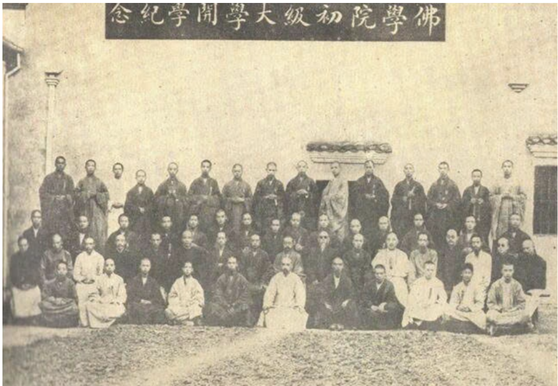
Chụp ảnh kỷ niệm lễ khai giảng Đại học Sơ cấp thuộc Phật học viện Vũ Xương.

Trong các luận trước, Đại sư Thái Hu đã bày tỏ niềm trăn trở sâu sắc trước thực trạng giáo dục tăng-già từ cuối thời Thanh, đồng thời đặt ra những yêu cầu cấp tiến hơn cho thời đại mới. Ngài chỉ ra rằng, nền giáo dục Phật giáo cuối thời Thanh và đầu thời Trung Hoa Dân quốc vốn không xuất phát từ nhu cầu toàn cục của đạo Pháp, cũng không phụng sự trọn vẹn cho tiến trình ' Tín - Giải - Hành - Chứng ' cốt lõi, càng không mang tính phổ quát.