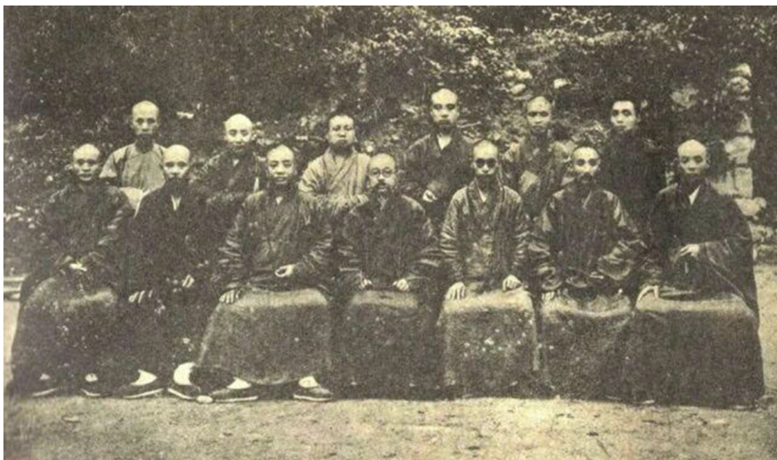
Chụp ảnh lưu niệm Tăng chúng Phật học viện Cửu Hoa chào đón Đại sư Thái Hư vào tháng 9 năm 1929.

Trước những bất cập của Phật giáo đương thời, Đại sư Thái Hư đã khởi xướng công cuộc cải cách thiết thực, lấy việc nâng cao giáo dục tăng già và bồi dưỡng tăng tài làm thế phát túc. Đại sư khẳng định: muốn duy trì mạng mạch Phật pháp cần phải nương tựa vào Tam bảo, mà trong đó, “ tăng bảo đóng vai trò cốt lõi ”. Do đó, suốt cuộc đời hành đạo, Ngài luôn đặt việc kiện toàn hàng ngũ tăng già làm trọng tâm, với hạt nhân là tư tưởng giáo dục tăng sĩ hiện đại.