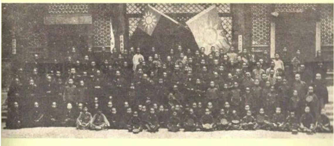
Chụp ảnh lưu niệm Tứ chúng Bắc Bình chào đón Đại sư Thái Hư tại chùa Bách Lâm vào tháng 5 năm 1930.

Sức ảnh hưởng từ phong trào giáo dục của Đại sư còn lan tỏa sâu rộng khi học tăng tốt nghiệp từ các trường này đã trở thành lực lượng giảng sư nòng cốt tại nhiều cơ sở Phật học khác như: Trúc Lâm, Ngọc Sơn, Pháp Giới, Quang Cống, Tê Hà, Hoàng Từ và Chúc Thánh.