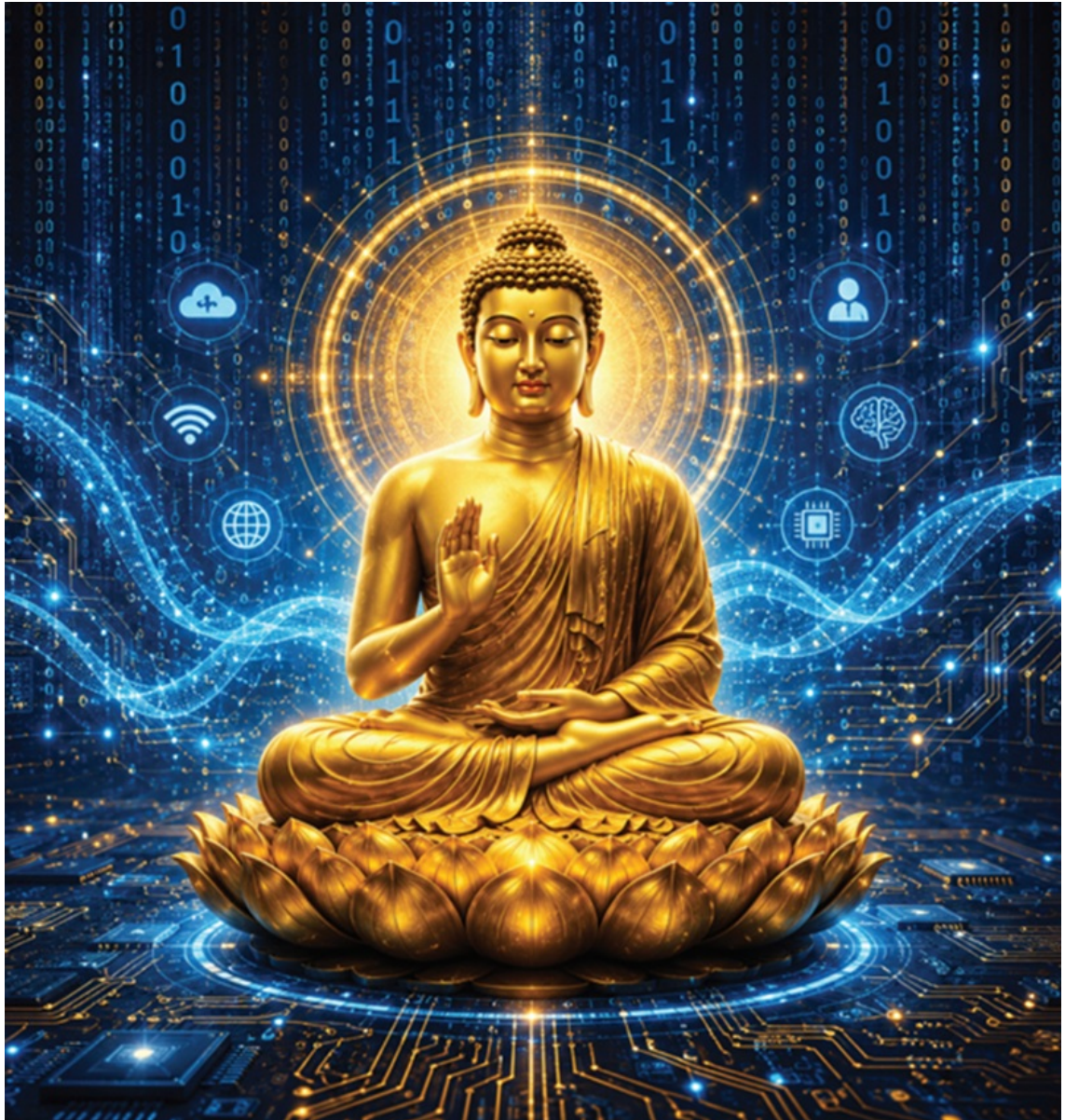
Hình ảnh được tạo bởi AI

Tinh thần ấy khiến đạo Phật có khả năng thích ứng mạnh mẽ với những biến đổi của lịch sử.