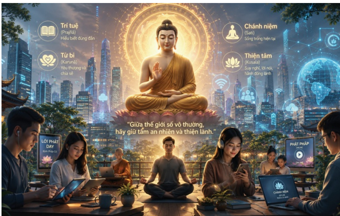
Hình ảnh được tạo bởi AI

Nhân loại đang sống trong thời đại mà khoảng cách địa lý dường như ngăn lại, chỉ bằng một cái chạm trên các thiết bị số hóa. Những luồng thông tin, hàng hóa, tri thức, tư tưởng và cả những hệ giá trị văn hóa không ngừng dịch chuyển giữa các quốc gia. Người ta gọi đó là thời kỳ hội nhập và kỷ nguyên công nghệ.