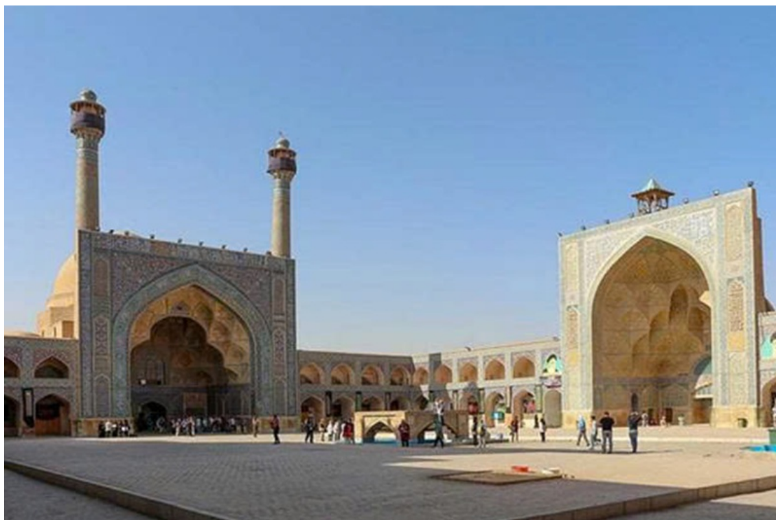
Nhà thờ Hồi giáo Jameh của Isfahan, Iran.

Nếu mô tả này chính xác, có thể phản ánh sự ảnh hưởng của vị tu sĩ Phật giáo trụ trì trước đây đã cải đạo sang Hồi giáo. Hoặc có lẽ đây chỉ đơn thuần là sự hiểu lầm về một phong tục hoàn toàn thuộc về Phật giáo?