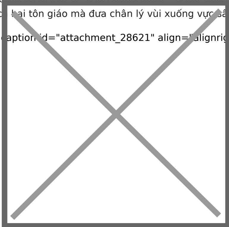
Hình ảnh chỉ mang tính chất

[caption id="attachment_28621" align="alignright" width="400"]