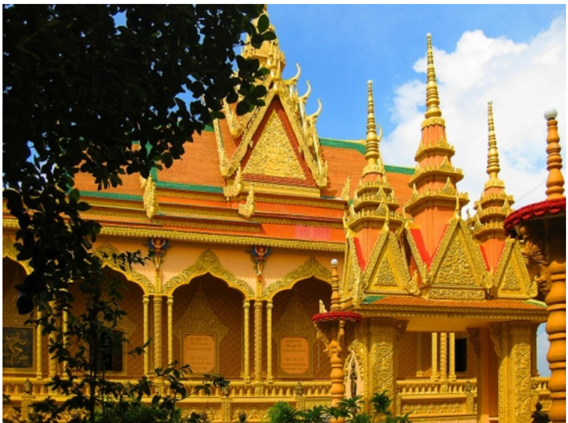
Hình minh họa.

Trong lịch sử hình thành và phát triển của cộng đồng Khmer Nam Bộ, chùa vừa là nơi thực hành tín ngưỡng Phật giáo Nam tông, vừa là trường học truyền thống, trung tâm văn hóa và không gian lưu giữ tri thức dân tộc. Nhiều giá trị văn hóa, đạo đức và phong tục tập quán của người Khmer được bảo tồn, trao truyền và tái tạo thông qua các hoạt động của nhà chùa.