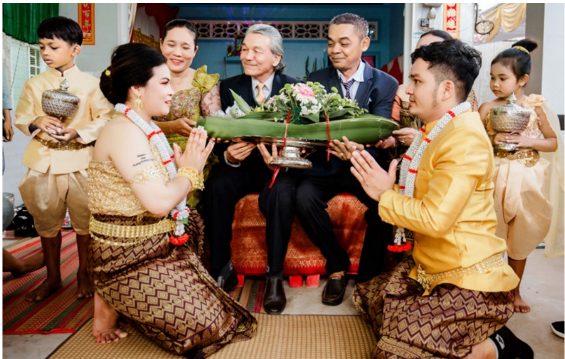
Hình minh họa.

Trong nhận thức truyền thống, mỗi gia đình luôn là một phần của phum sóc.