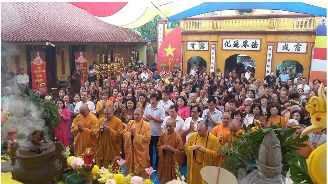
Chư tôn đức cùng các vị Đại biểu làm lễ dâng hương bạch Phật bái Tổ tại chính điện chùa Duệ Tú.