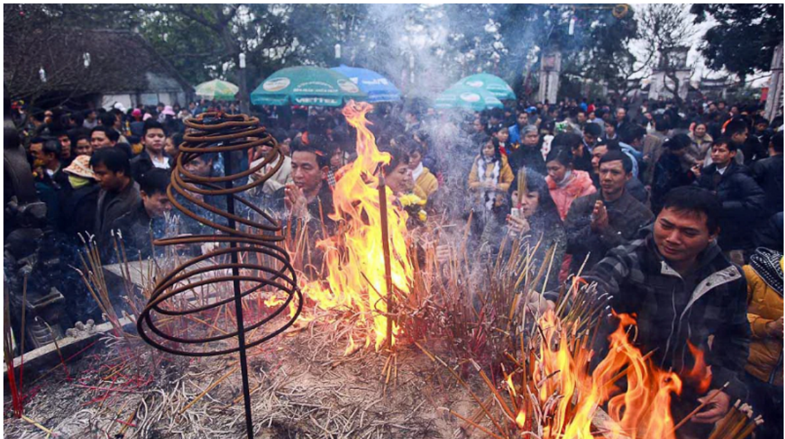
Hình ảnh chỉ mang tính chất minh họa.

Thờ cúng tổ tiên là nét đẹp tâm linh truyền thống của mọi gia đình Việt. Đi kèm với đó là thói quen thắp hương vào các ngày Rằm, mừng Một, đặc biệt là vào các ngày lễ, Tết, giỗ chạp. Tuy nhiên ngày nay, việc thắp hương không chỉ dừng lại ở nghi thức để bày tỏ tấm lòng thành kính, tưởng nhớ đến ông bà tổ tiên, mà có nhiều gia đình lập ban thờ Phật, thờ gia tiên, sau đó việc thắp hương trở thành một hình thức bắt buộc, dần làm cho các thành viên trong gia đình trở về vấn đề này: Có nên thắp hương hàng ngày hay chỉ thắp hương vào Rằm và mừng 1? Chỉ thắp hương vào buổi sáng hay dùng hương vòng thắp liên tục? Việc thờ cúng tưởng chừng đơn giản bỗng trở thành nỗi băn khoăn của không ít gia đình.