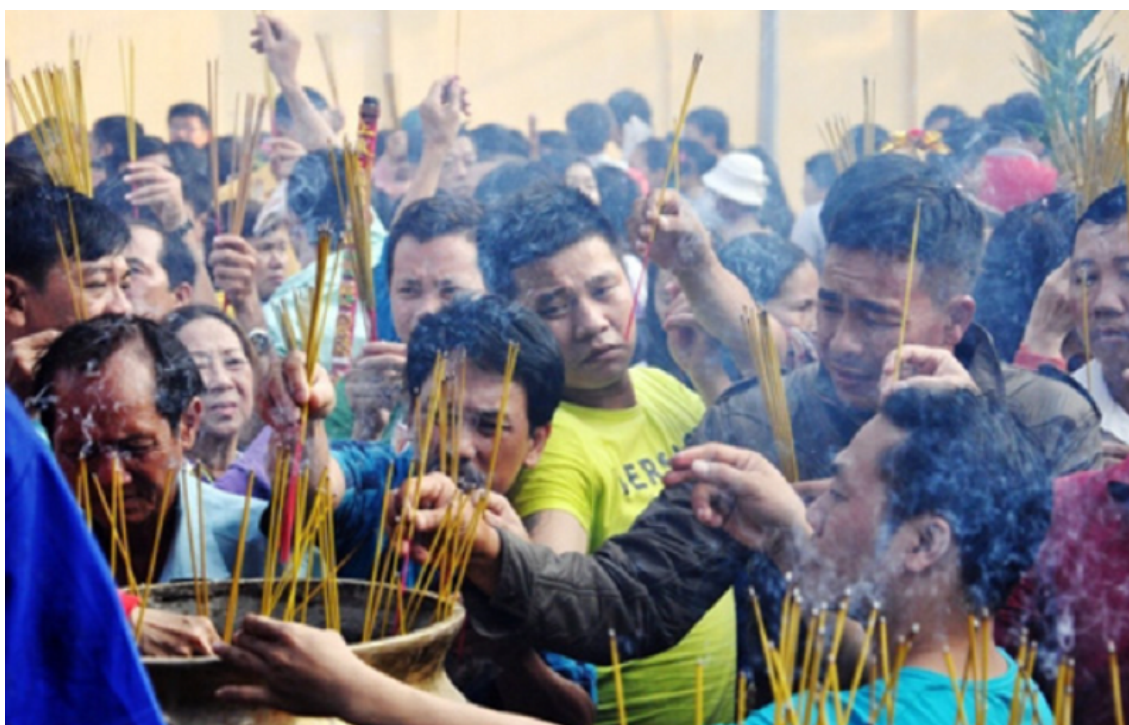
Hình ảnh chỉ mang tính chất minh họa.

Thực sự rất nguy hiểm khi họ bất chấp tiềm ẩn về cháy nổ, dù biết là không an toàn mà họ vẫn làm để yên tâm rằng như thế là đúng phép đúng lễ lối với tổ tiên, Chư Phật. Chưa kể đến, hoá chất từ hương dù là hương sạch cũng không thể đảm bảo sức khỏe 100%. Liệu việc làm này có thực sự đúng đắn theo giáo lý đạo Phật hay không?