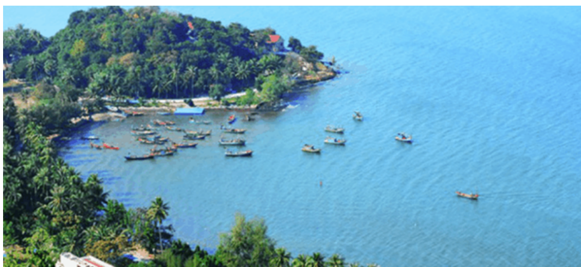
Quang cảnh ngày nay của biển đảo Hà Tiên (Kiên Giang cũ, nay là tỉnh An Giang) chụp từ trên cao.

Dòng giao thương biển cả âm thầm kéo dài qua nhiều thế kỷ ấy đã chuẩn bị những điều kiện lịch sử quan trọng để về sau, Hà Tiên vươn mình thành một thương cảng phồn thịnh - “ Cảng Khẩu Quốc ” nơi góc biển phương Nam. Trên nền địa lý mở ra biển lớn, trên lớp trầm tích văn hóa Óc Eo - Phù Nam - Khmer và trong nhịp chuyển động của hải thương Minh - Thanh, sự xuất hiện của Cư sĩ Mạc Cửu ở Hà Tiên vào cuối thế kỷ XVII không còn là một biến cố đơn lẻ, mà là điểm hội tụ của những dòng chảy lịch sử lâu dài: di dân, thương mại, quyền lực và khát vọng dựng nghiệp nơi miền biên hải.