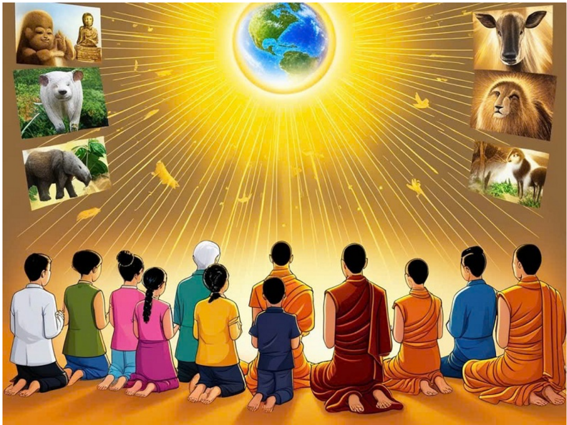
Hình ảnh được tạo bởi công nghệ AI.

Làm từ thiện: Khi làm từ thiện, hãy hồi hướng công đức cho tất cả những người gặp khó khăn.