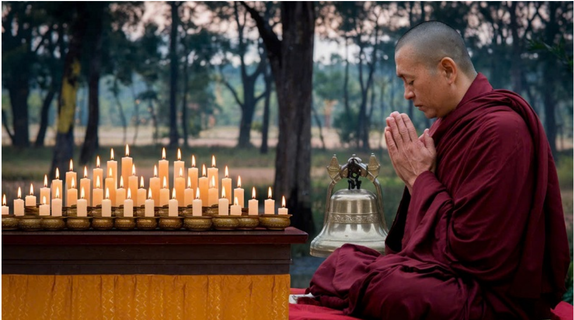
Hình ảnh được tạo bởi công nghệ AI.

Hồi hương là việc chuyển dâng công đức tích lũy được đến một mục tiêu cao cả, chẳng hạn như cầu nguyện cho sự giác ngộ của chính mình, sự an lạc của tất cả chúng sinh, hoặc hòa bình thế giới. Đức Phật dạy trong Kinh Đại Bảo Tích: