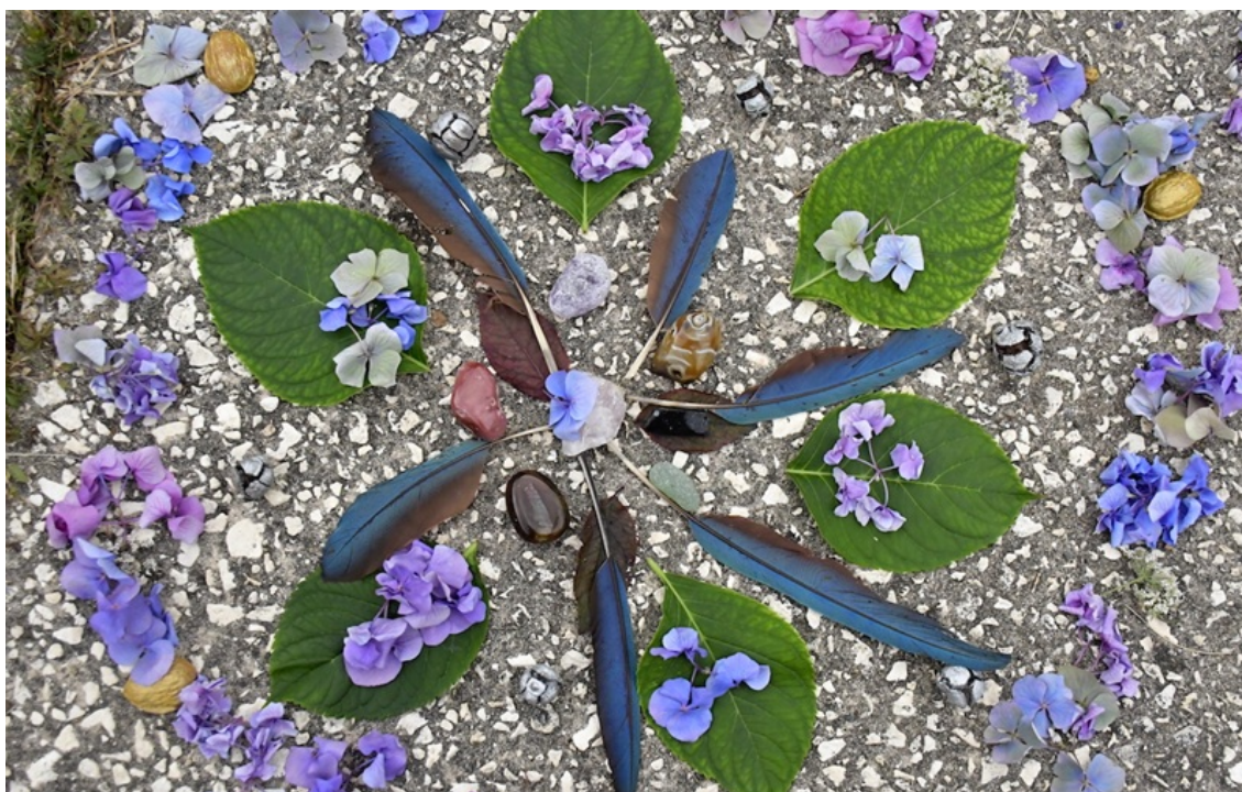
Hình mang tính minh họa.

hiện ra ở điểm thấp nhất trên đất liền của Trái Đất, mang độ mặn cực hạn đến mức không một loài thủy sinh nào có thể sinh tồn. Thế nhưng, thiên nhiên không chỉ ban tặng cho nơi đây nổi ngọt ngào; nguồn bùn khoáng và làn nước đậm đặc của Biển Chết lại ẩn chứa những dược tính chữa bệnh và dưỡng da độc nhất vô nhị.