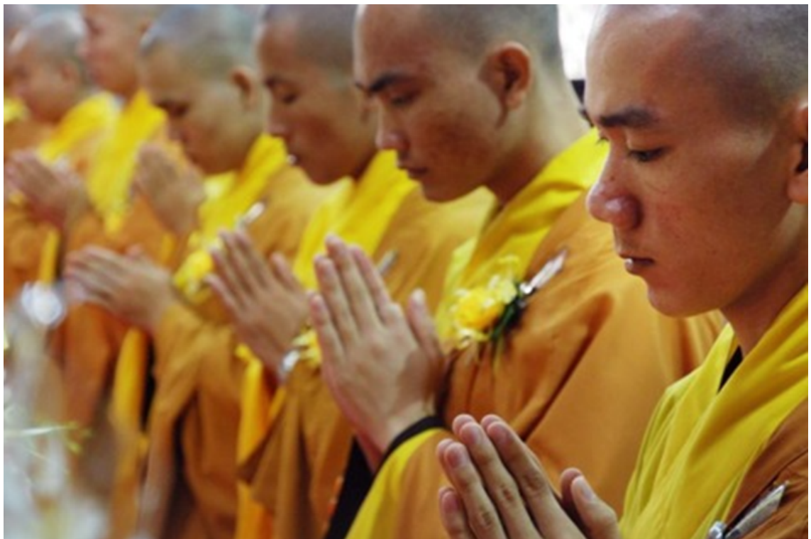
Hình ảnh chỉ mang tính chất minh họa (sưu tầm).

Thậm chí có học giả cho rằng, không có “ Thiền định ” thì không thể thành lập Phật giáo[14].