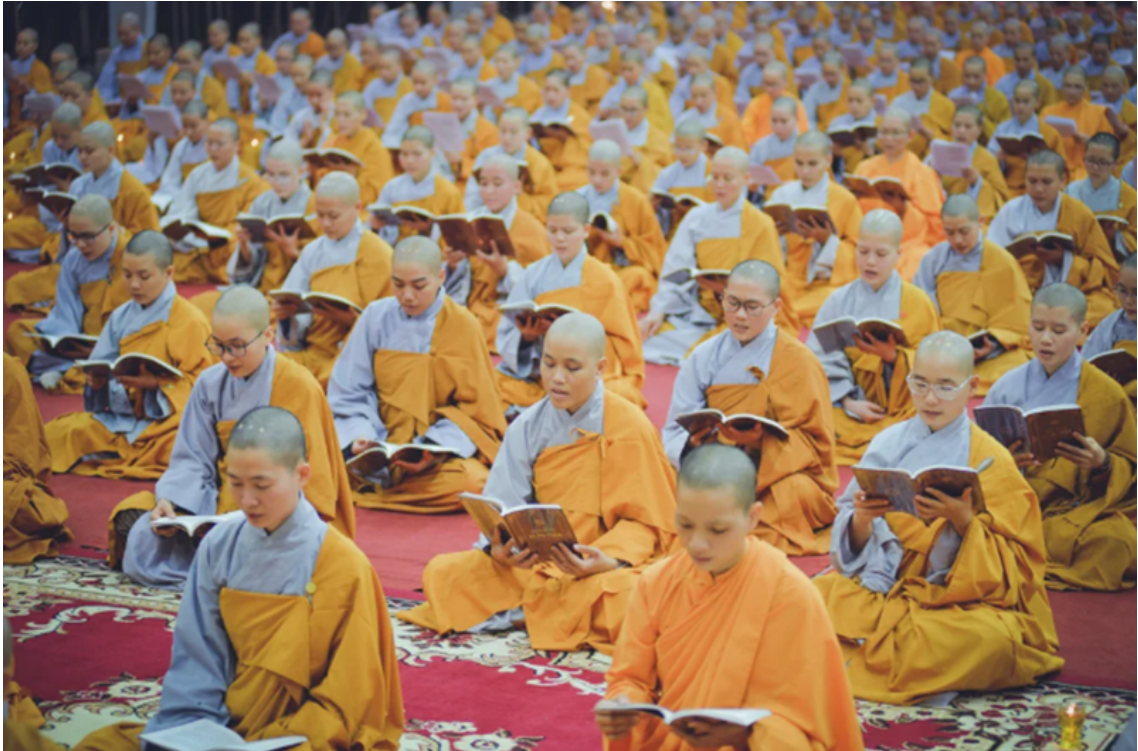
Hình ảnh chỉ mang tính chất minh họa (sưu tầm).

Sự chuyển hóa này mở ra nhiều con đường chứng ngộ như ngôn ngữ, hình tượng, cảnh giới. Nó khiến sức ảnh hưởng của Thiền thấm sâu vào văn hóa, đặc biệt là văn học nghệ thuật.