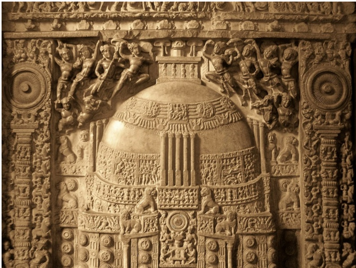
Phù điêu tháp Amaravati.

Chuyển Pháp luân lần thứ nhất tại Vườn Lộc Uyển đặt nền tảng với Tứ diệu đế , giới luật và con đường giải thoát dành cho Thanh văn (śrāvaka) và Duyên giác (pratyekabuddha). Lần thứ hai tại Linh Thứu Sơn khai mở hệ thống kinh Bát Nhã, giáo lý tính Không (sūnyatā), cắt đứt chấp thủ vào tự tính cố hữu. Và lần thứ ba tại Dhanyakataka chính là đỉnh điểm: Đức Phật xuất hiện dưới hình tướng Kalachakra để truyền trao sự hợp nhất bất nhị giữa tính Không và Phật tính, kết nối thời gian vũ trụ, chu kỳ thiên văn và hệ thống kinh mạch vi tế trong thân người thành con đường giác ngộ trực tiếp.