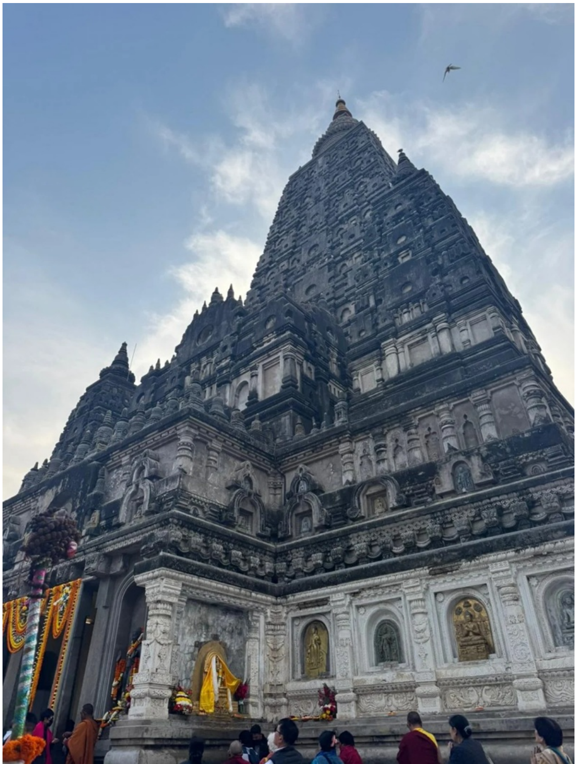
Đền Maha Bodhi, Bồ Đề Đạo Tràng.