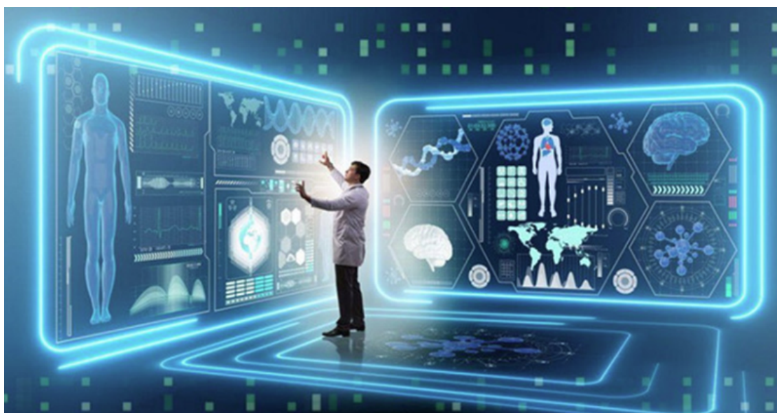
Hình ảnh chỉ mang tính chất minh họa (sưu tầm).

Bản chất của thực tại thực ra chỉ đơn giản như vậy. Chỉ một tiên đề khởi nguyên đó thôi đã lập tức hóa giải Vấn đề nan giải của ý thức, cùng vô số những ngõ cụt logic khác lâu nay. Tuy nhiên, cái giá của chân lý là một cuộc đại cách mạng: Nó buộc chúng ta phải tái tư duy lại toàn bộ nền toán học, vật lý, sinh học, vũ trụ học, triết học và thậm chí cả thần học. Đây chính là ranh giới tiên phong mới - một bình minh của một thế giới hoàn toàn mới.