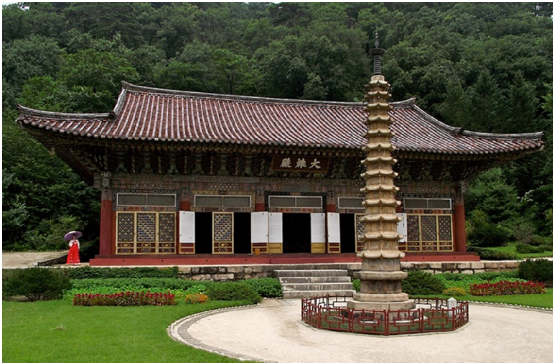
Điện Daeungjeon, một bảo vật quốc gia của Cộng hòa Dân chủ Nhân dân Triều Tiên

Cảm giác đầu tiên khi bước vào khuôn viên Chùa Phổ Hiền là sự choáng ngợp bởi vẻ đẹp và sự tĩnh lặng của thiên nhiên . Dãy núi Myohyang, được xem là một trong những ngọn núi linh thiêng nhất Triều Tiên, bao bọc ngôi chùa trong một bầu không khí hoàn toàn trong lành và lặng sạch, thanh tịnh như hư không.