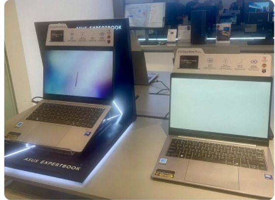
Asus Exclusive Store đầu tiên tại Việt Nam (161 Xã Đàn, Hà Nội)