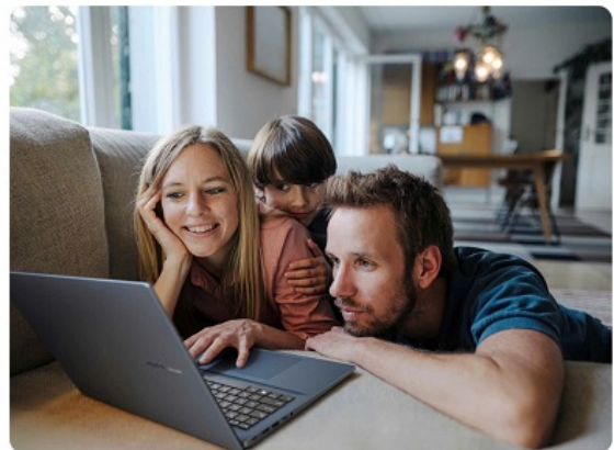
Một số dòng "laptop AI" mới nhất của Asus.