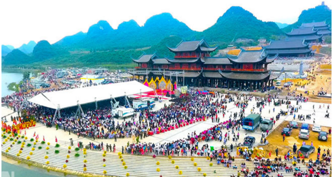
Đại lễ Vesak 2019 tại Việt Nam.