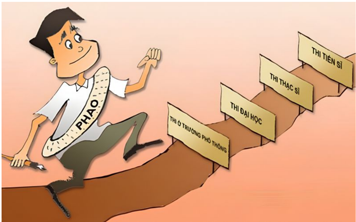
Hình mang tính minh họa.

Dưới ánh sáng giáo lý Phật giáo, gian lận thi cử không đơn thuần là hành vi vi phạm quy chế hay pháp luật. Đó còn là biểu hiện của một đời sống nội tâm bị chi phối bởi lòng tham, sự si mê và sự thiếu tỉnh thức; là dấu hiệu cho thấy con người đã rời xa con đường chân chính mà đức Phật chỉ dạy.