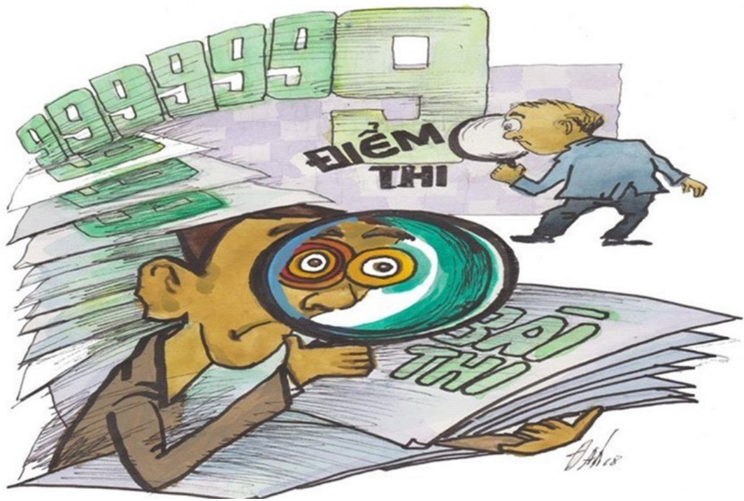
Hình mang tính minh họa.

Khi nhiều người tin rằng thành công có thể đạt được bằng mưu mẹo thay vì nỗ lực, xã hội sẽ dần hình thành một hệ giá trị lệch lạc, trong đó sự trung thực bị xem là thiệt thòi còn sự gian dối lại được ngụy biện như một cách thức để tồn tại và thành công.