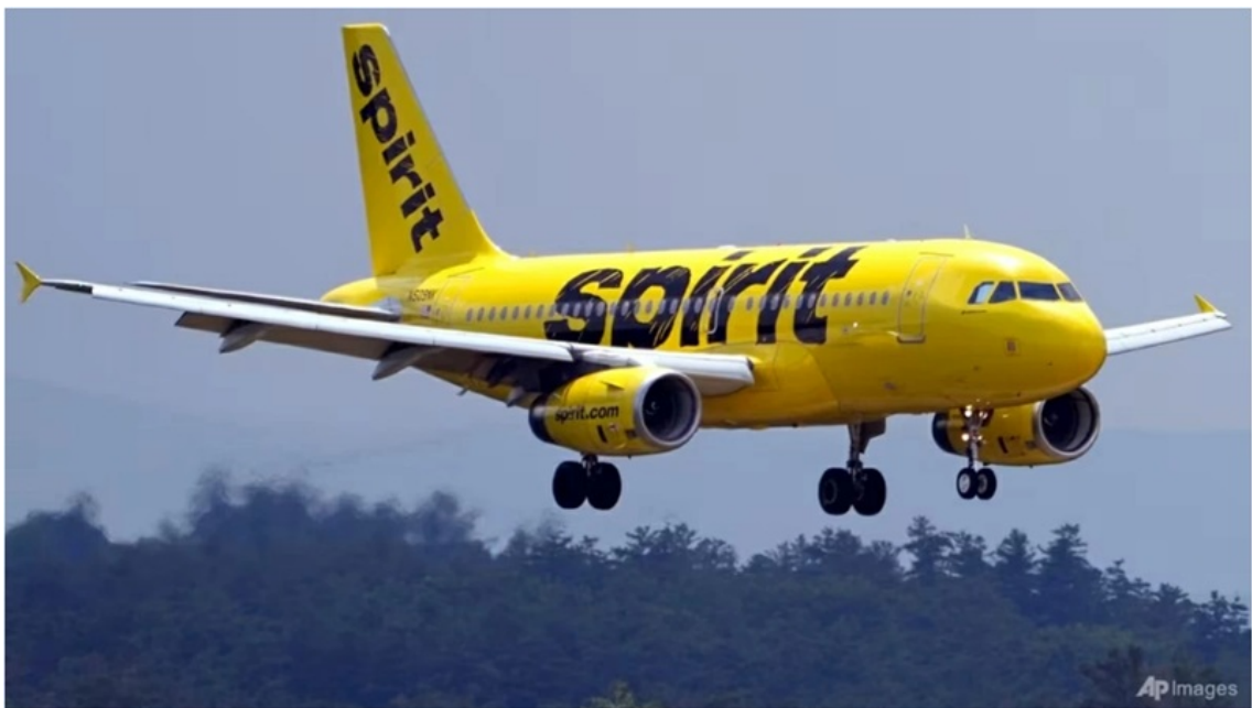
Các chuyến bay bị hủy hàng loạt sau khi Spirit Airlines tuyên bố ngừng hoạt động, phản ánh tác động lan rộng của cú sốc giá nhiên liệu đối với ngành hàng không toàn cầu.

Giá dầu tăng, thị trường tài chính biến động, chuỗi cung ứng chịu áp lực và ngành hàng không trở thành một trong những lĩnh vực phản ứng nhạy cảm nhất.