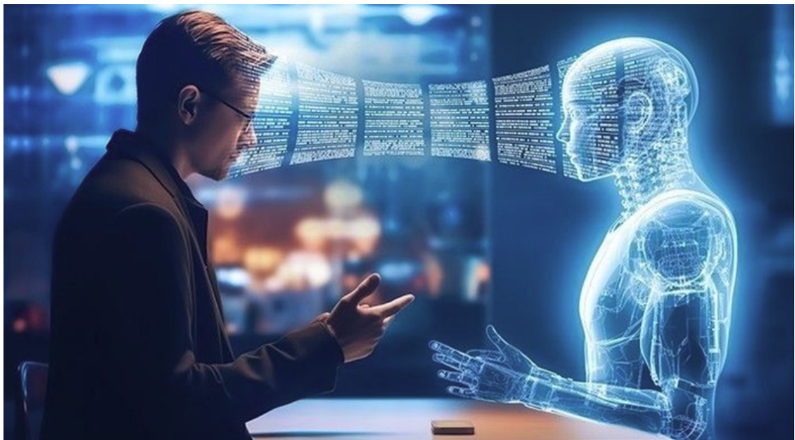
Hình ảnh chỉ mang tính chất minh họa. Ảnh sưu tầm