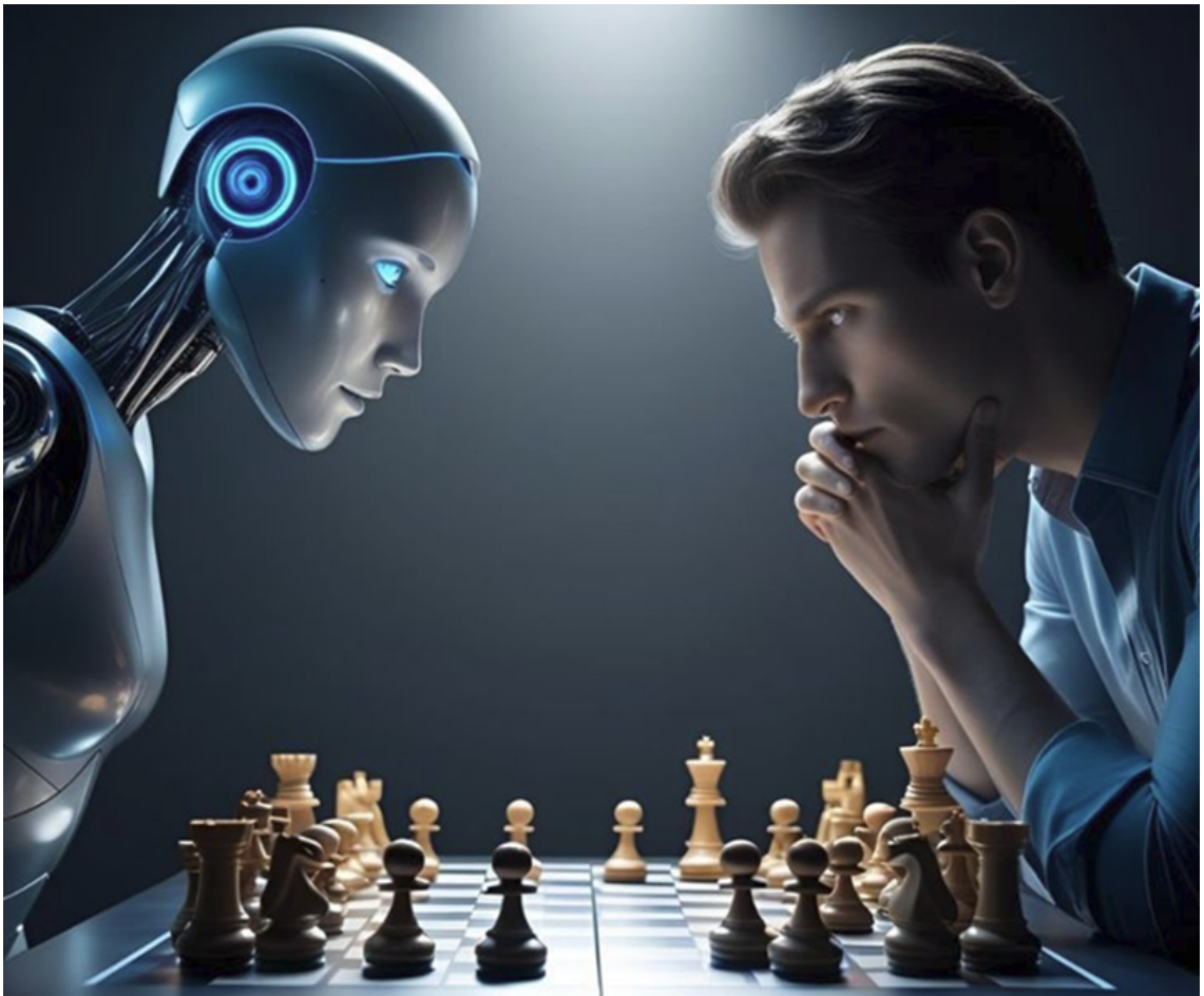
Hình ảnh chỉ mang tính chất minh họa.