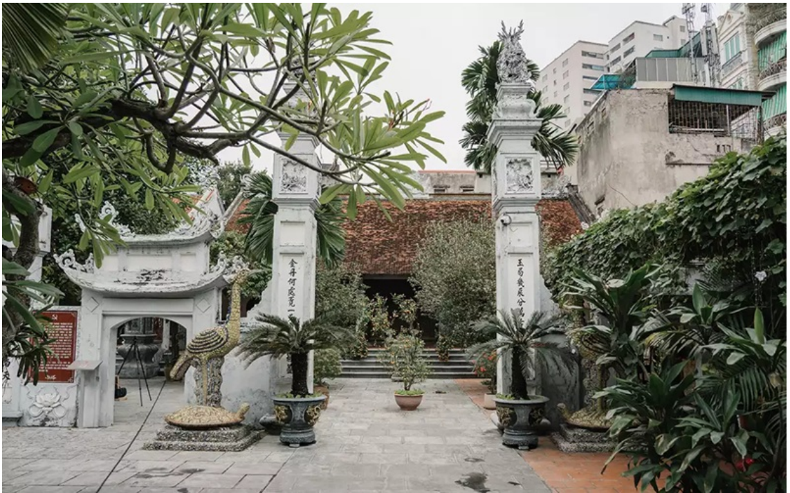
Hình minh họa chùa thời Lê.

Bản trùng san tuy không có đoạn trên, nhưng khi đề cập đến Lê Lợi, cũng nhắc ở trang 230, dòng 4 như sau: [ ] nghĩa là: Khi đó, vua sai gia nhân cày [ruộng] ở động Chiêu Nghi, xứ Phật Hoàng.