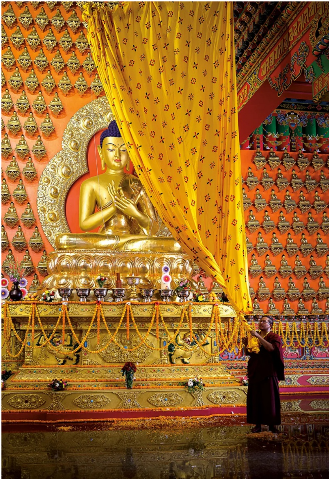
Thiên Phật Tự (Thousand Buddha Temple) tại Lumbini, Nepal.

Ông nói: “Chúng tôi tin vào luật nhân quả. Điều gì mình cho đi, mình sẽ nhận lại trong đời sau”.