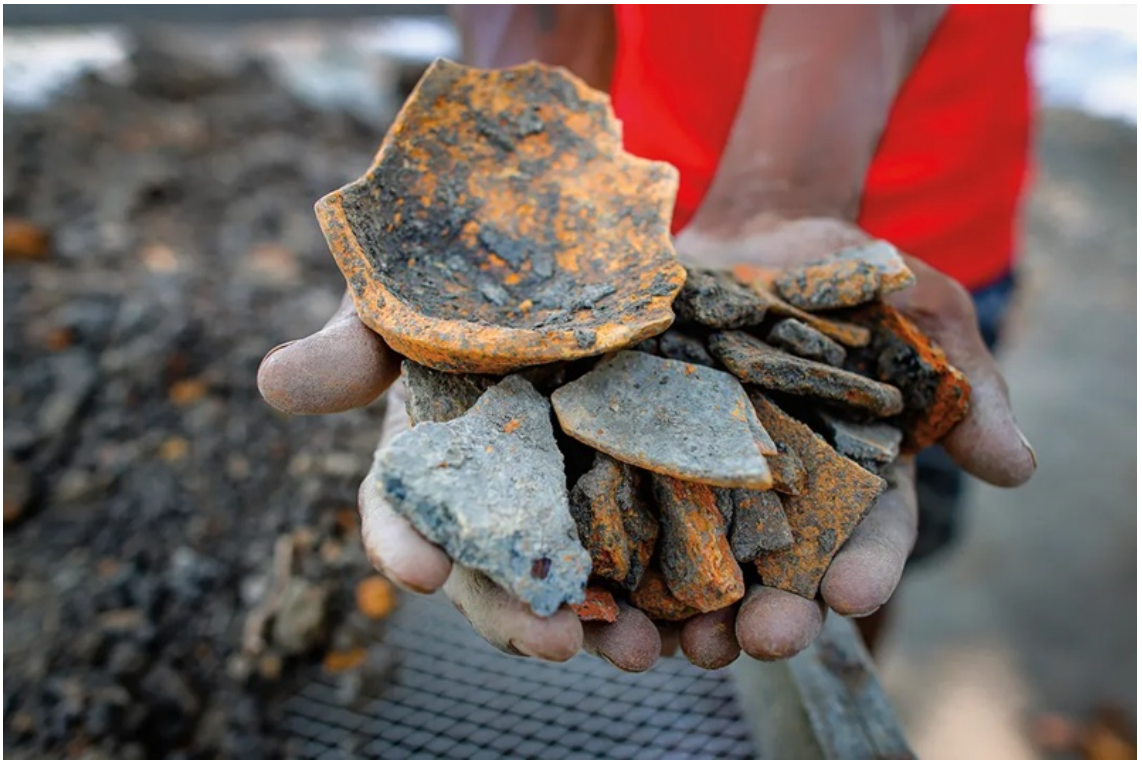
Những mảnh gốm đất nung cổ được tìm thấy tại khu di chỉ.

Phải mất hơn một thập kỷ sau khi quy y, A Dục Vương mới đến được Lumbini. Ông cho vận chuyển hoặc sai thuộc hạ vận chuyển những cột đá sa thạch khổng lồ từ mỏ đá nằm gần trung tâm đế quốc, cách đó khoảng 320 km.