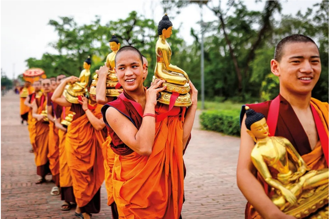
Các tăng sĩ Phật giáo Tây Tạng rước tượng Phật qua các tuyến phố.

+ Trung tâm Văn hóa và Làng Lumbini Mới (Cultural Center and New Lumbini Village): nơi có bảo tàng, viện nghiên cứu Phật học quốc tế, Đại Bảo tháp Hòa bình Thế giới và khu bảo tồn chim sếu.