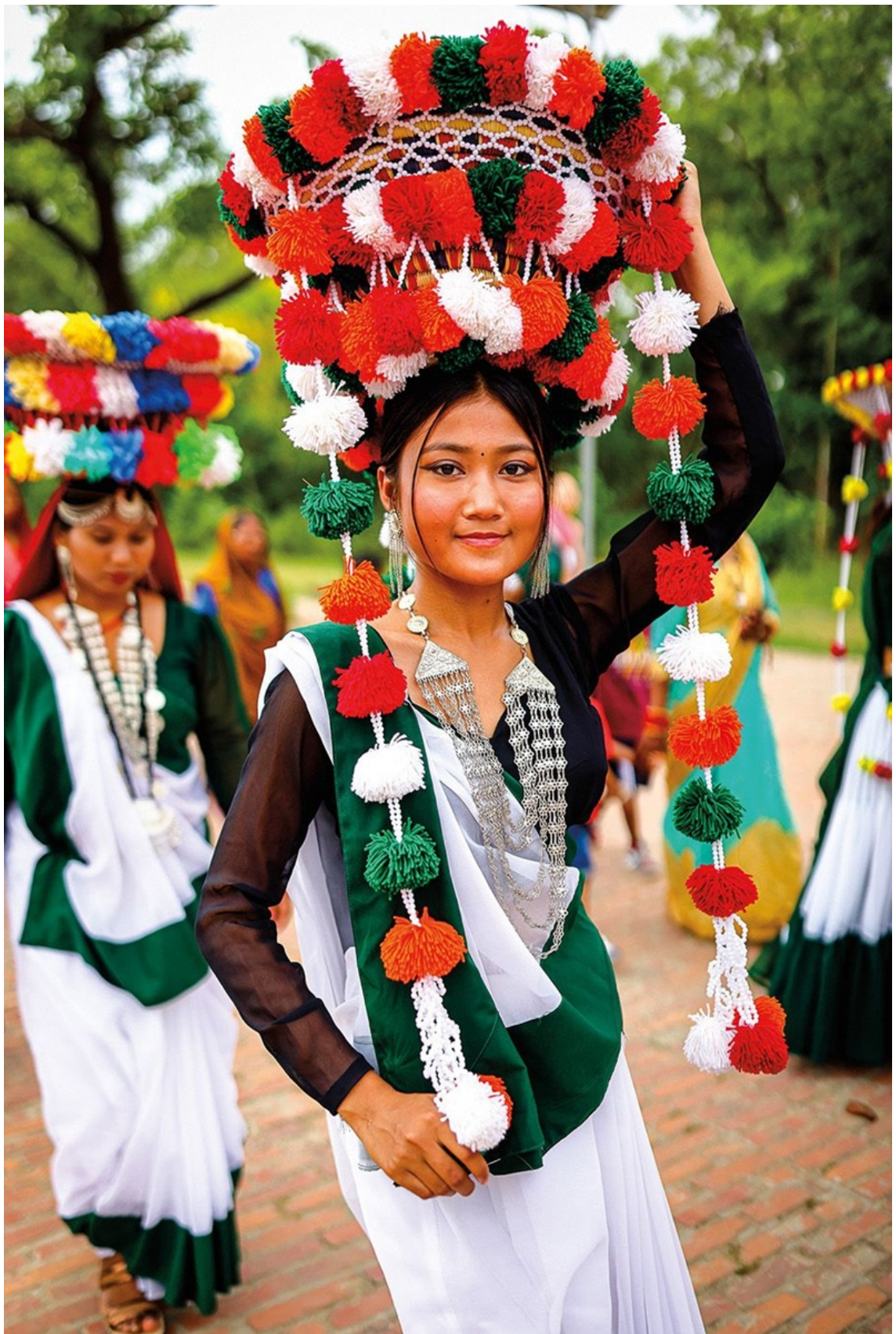
Phụ nữ thuộc cộng đồng Tharu - một sắc tộc chủ yếu theo Ấn Độ giáo ở miền nam Nepal và miền bắc Ấn Độ - tham gia đoàn diễu hành mừng ngày Đức Phật Đản sinh.