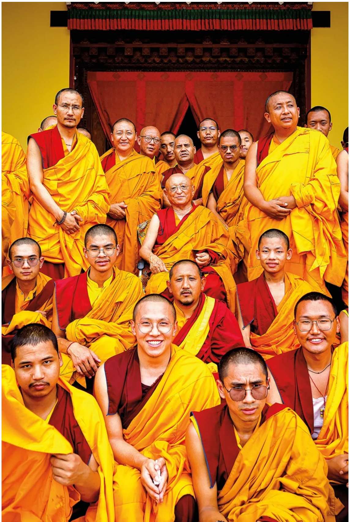
Các tăng sĩ Tây Tạng quyên quần quanh vị trụ trì của mình (ngồi giữa).