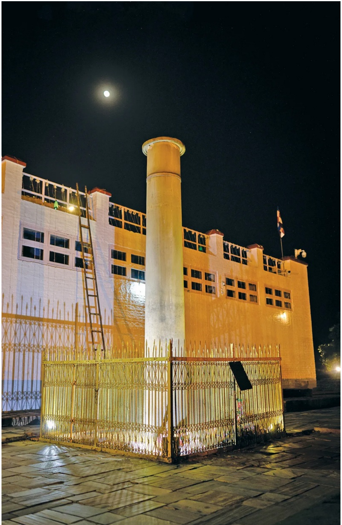
Trụ đá A Dục Vương, được phát hiện trở lại vào năm 1895.

Tuy nhiên, một số tín đồ lại đặt câu hỏi: vì sao giới khoa học lại quyết tâm khai quật quá khứ đến như vậy?