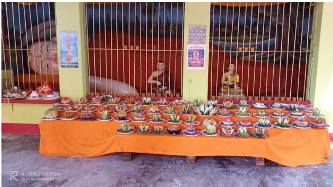
Tượng Phật trong tư thế nằm nghiêng, từ Unainpura Shri Shri Buddha-Pada Mondir, ở làng Unainpura, Patiya, Chattogram.

Barua và Simha-Barua tập trung tại các khu vực như Chattogram, Cox's Bazar, Comilla, Noakhali, Barguna, Patuakhali và Dhaka.