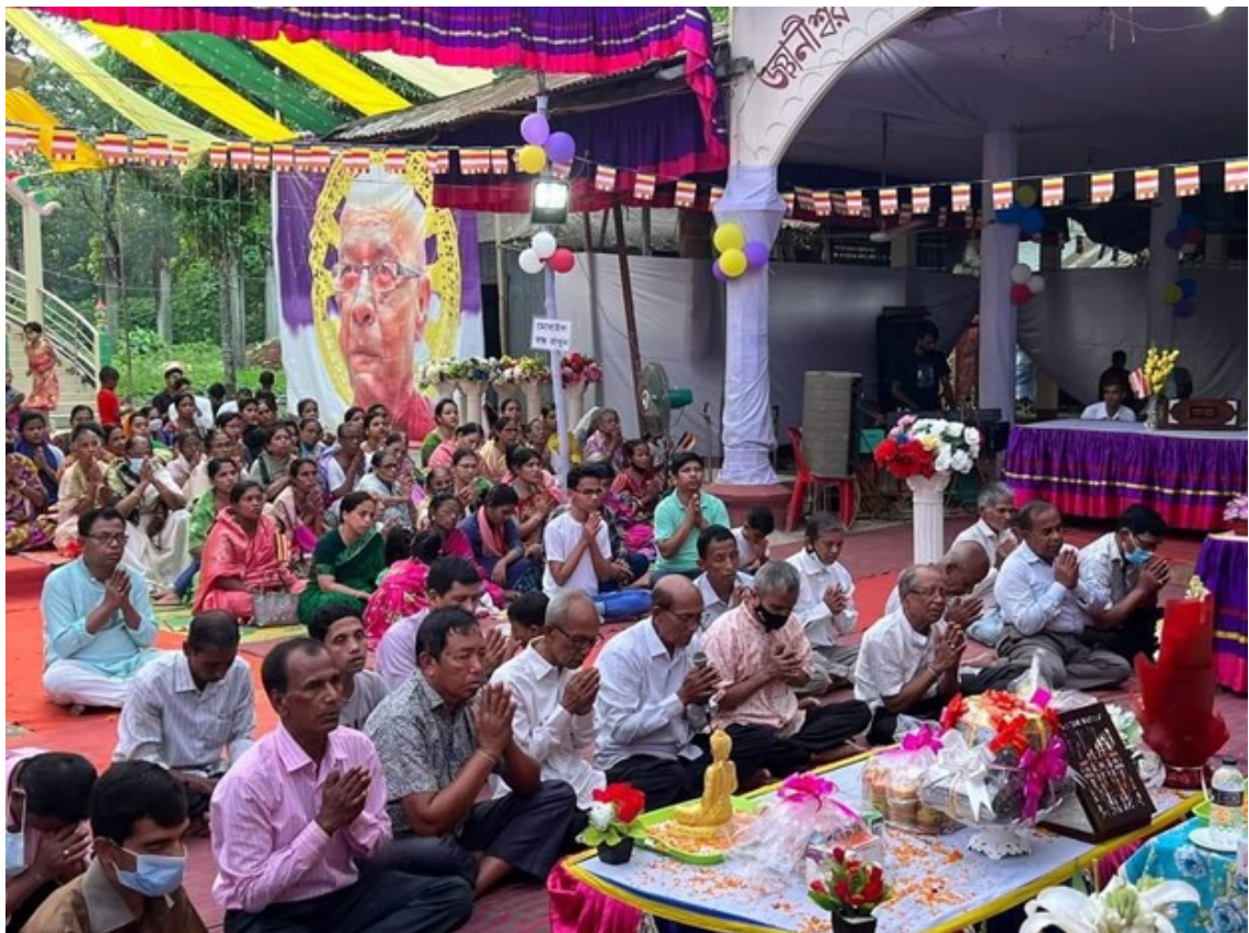
Phật tử Barua cúng dường chư tăng, trong đó các món ăn truyền thống và vật dụng cần thiết được dâng lên các nhà sư, tại tu viện Phật giáo Unainpura Lankarana, ở Patiya Subdistrict của Chattogram,

Barua và Simha-Barua tập trung tại các khu vực như Chattogram, Cox's Bazar, Comilla, Noakhali, Barguna, Patuakhali và Dhaka.