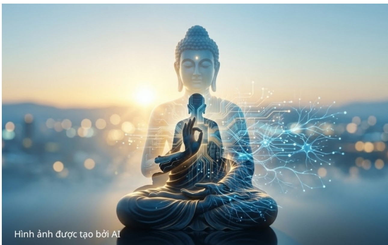
Hình ảnh được tạo bởi AI

Vì vậy, một mặt, việc ứng dụng AI trong Phật giáo Nhân văn phản ánh tiến trình chuyển hóa hiện đại của Phật giáo; nhưng mặt khác, những nguy cơ tiềm ẩn của AI cũng cần được nhận diện một cách thận trọng và tỉnh thức.