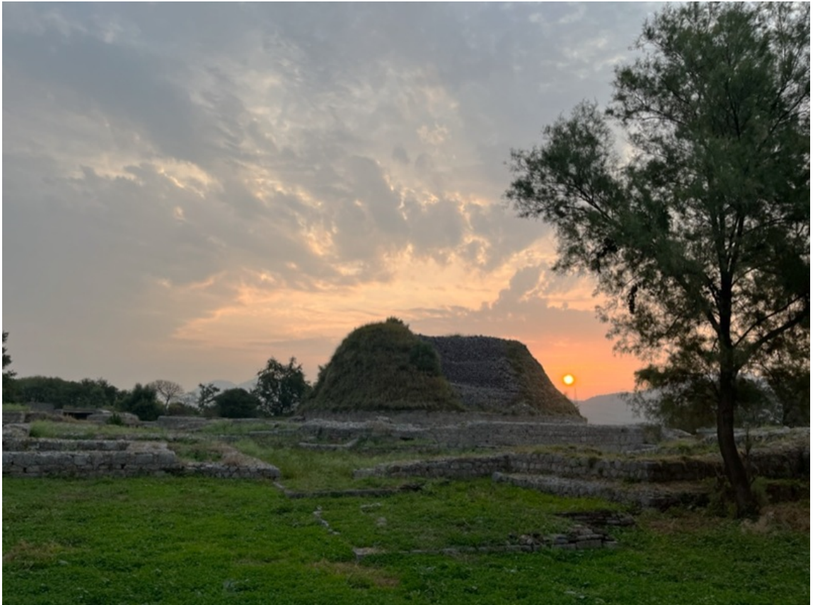
Những di tích Phật giáo tại bảo tháp Dharmarajika ở Taxila.

Hay như đại học Phật giáo Nālandā (Na Lan Đà), thuộc bang Bihar của Ấn Độ ngày nay, từng được xem là trung tâm đại học quan trọng bậc nhất thế giới cho đến khi bị phá hủy vào thế kỷ XII.