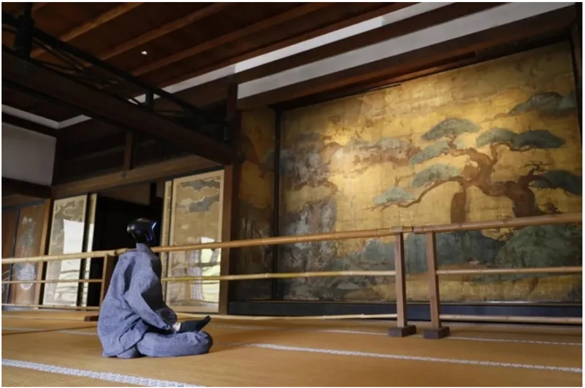
Buddharoid đang "thiền định".