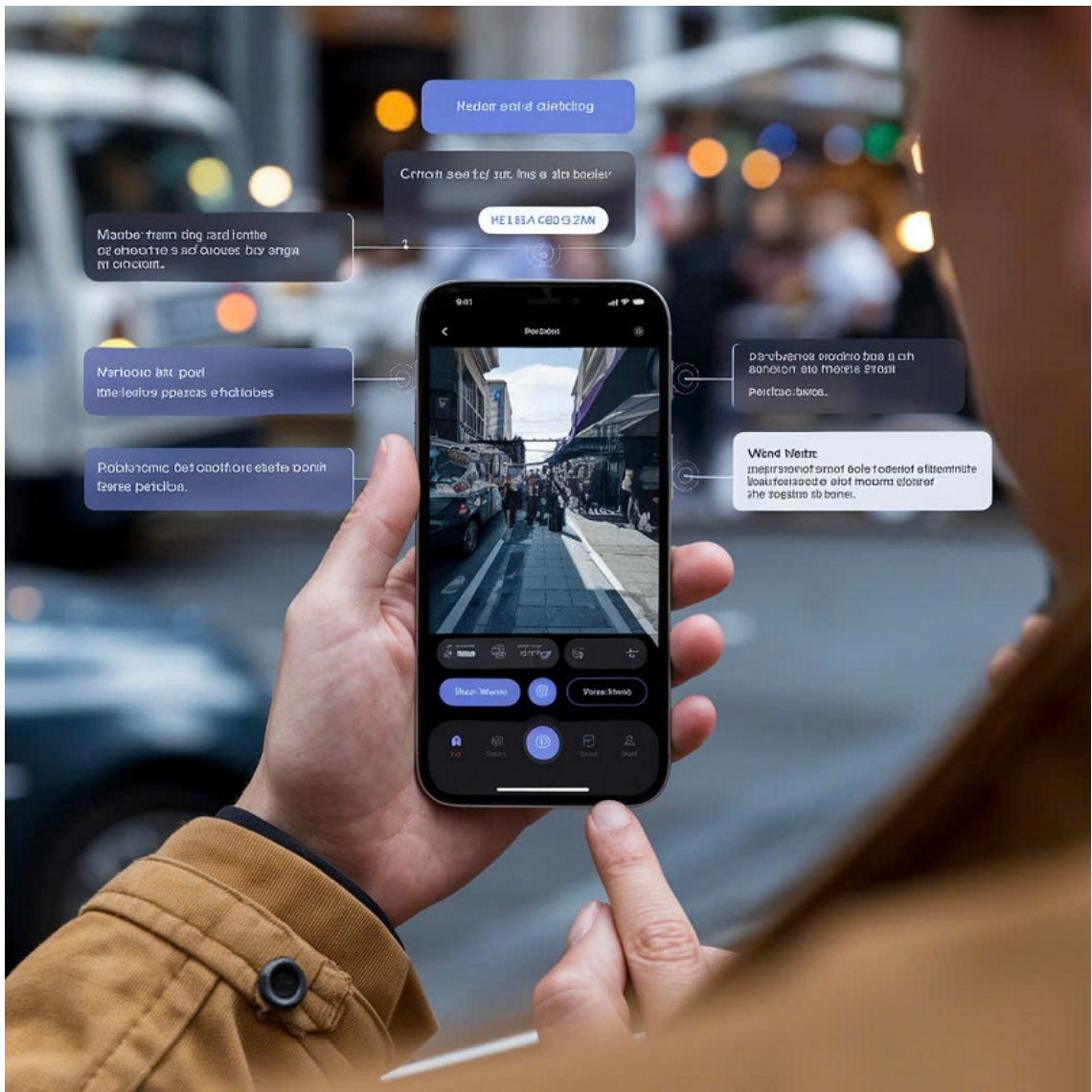
Hình minh họa (AI - Tạp chí Nghiên cứu Phật học).

Tuy nhiên, trong thời đại công nghệ số, khi AI (trí tuệ nhân tạo) trở thành công cụ đắc lực, vai trò của phóng viên ảnh đang thay đổi sâu sắc. Từ những chiếc máy ảnh cơ truyền thống đến máy ảnh kỹ thuật số hiện đại, rồi cả smartphone có chức năng chụp ảnh chuyên nghiệp, giờ đây AI còn mở ra khả năng sáng tạo vượt xa trí tưởng tượng của con người.