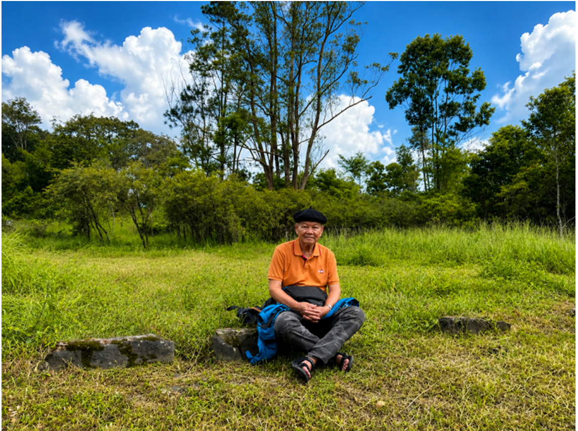
Tác giả ngồi trên nền móng Phương Bối Am tại Đồi Thông Phương Bối.

Những người tu học năm ấy đã khai khẩn đất đồi, làm đường, trồng trà, trồng hoa cúng Phật. Một đời sống thanh đạm và thiền vị âm thầm hình thành giữa núi rừng cao nguyên.