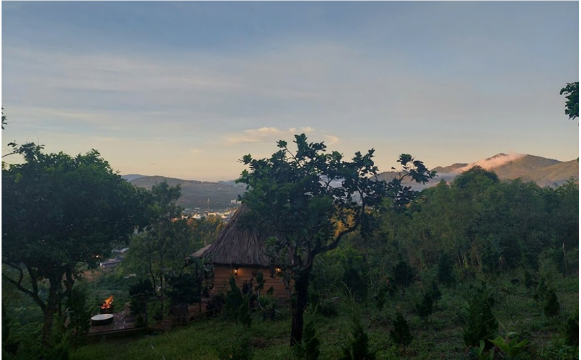
Tùng Lâm Thất bình yên trong sương sớm

Giữa triền đồi lộng gió, một thiền thất nhỏ mang tên Tùng Lâm Thất được dựng lên bên rừng thông. Trước sân là những vườn ươm sơn tùng non. Những cây tùng ấy rồi sẽ tiếp tục được mang đi trồng trên đất đỏ bazan Phương Bối khi đủ lớn để chịu được gió núi và sương lạnh cao nguyên. Có lẽ, việc chọn cây sơn tùng cũng mang theo một ý nghĩa riêng, biểu tượng cho sự thanh cao, bền bỉ và can trường giữa cuộc đời nhiều biến động.