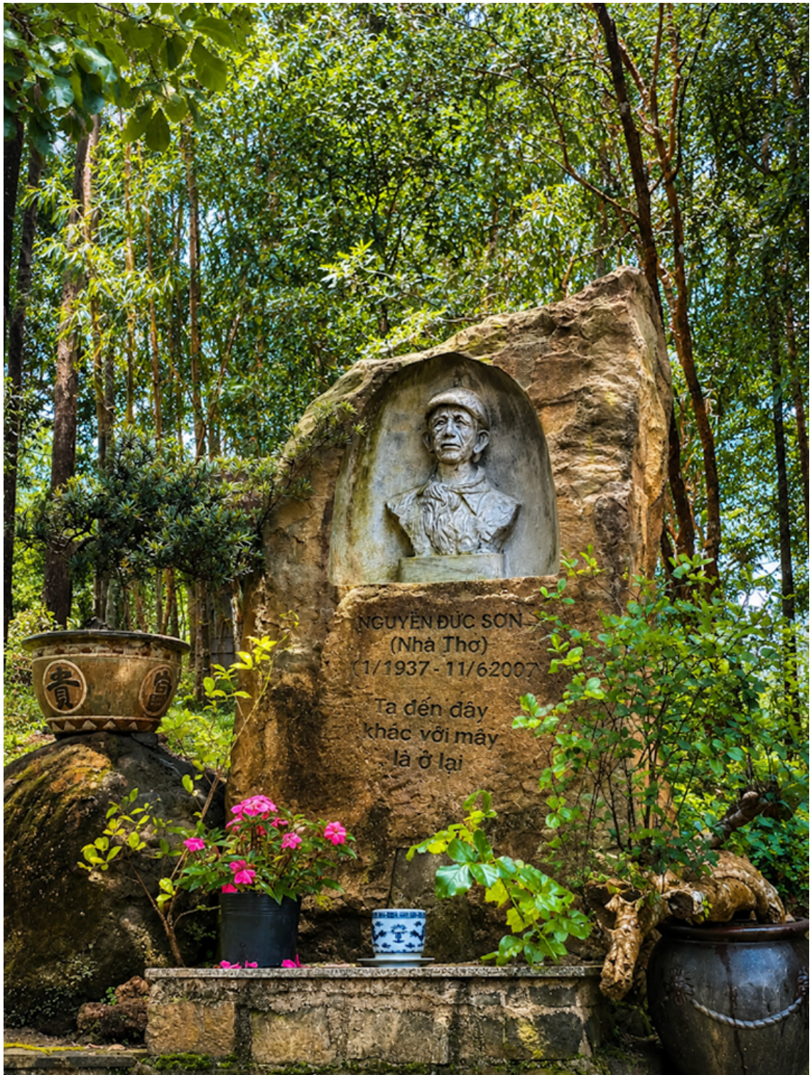
Mộ nhà thơ Nguyễn Đức Sơn tại Đồi Thông Phương Bối.

Cho đến năm 1979. Sau ngày đất nước thống nhất, cố thi sĩ Nguyễn Đức Sơn được giao lại mảnh đất rừng này, nơi mà trước đó những người đồng bào dân tộc đã nhượng lại cho Thiền sư Thích Nhất Hạnh. Ông đưa cả gia đình lên sống giữa vùng đồi gần như hoang phế ấy. Không điện. Không tiện nghi. Không phố thị. Chỉ có rau rừng, nấm dại, đất đỏ bazan và những mùa sương lạnh.