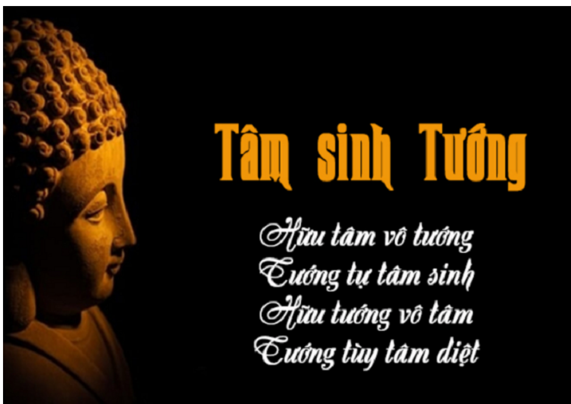
Ảnh minh họa (sưu tầm)

Người bình thường thiếu tập trung cho một công việc sẽ khó thành công, không đạt kết quả; một hành giả nhiều tưởng thức dễ đưa đến tẩu hỏa, hoang tưởng, bị lạc dẫn vào cảnh giới siêu thực. Tưởng thức là loại ma tâm, tần số tâm thức bị loạn nhịp hợp với tần số âm ngoại biên dẫn đến bất bình thường. Người không bình thường do hoang tưởng hiển lộ ra gương mặt, cặp mắt, hành động. Một người thiếu thiện cảm với ta, tuy không thể hiện ra hành động hay lời nói, ta vẫn cảm nhận được. Như vậy tưởng là loại năng lượng bao phủ quanh ta; tập tưởng thì khó phát hiện, tưởng thức mạnh sẽ hiển lộ rõ nét.