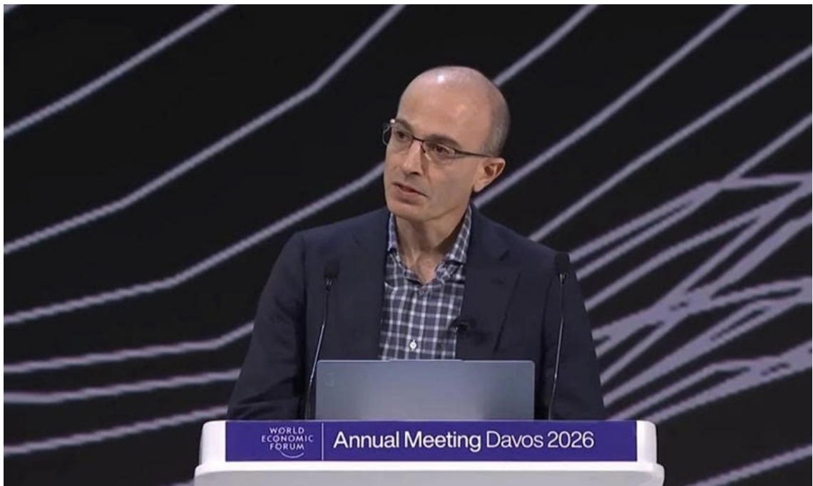
Thiền giả Yuval Noah Harari

Đại cuộc biến dịch ấy có thể ập đến ngay trong hai năm tới hoặc hiển lộ vào thập kỷ kế tiếp. Sử gia kiêm hành giả Yuval Noah Harari đã phát đi lời cảnh báo đanh thép: Trí tuệ nhân tạo (AI) ngày nay đã bám rễ sâu vào rường cột xã hội. Đến mức, tất cả những gì được cấu thành từ ngôn từ, điển hình là các tôn giáo cổ đại như Kitô giáo và Do Thái giáo, đứng trước nguy cơ bị thực thể này thôn tóm, tiếp quản hoàn toàn.