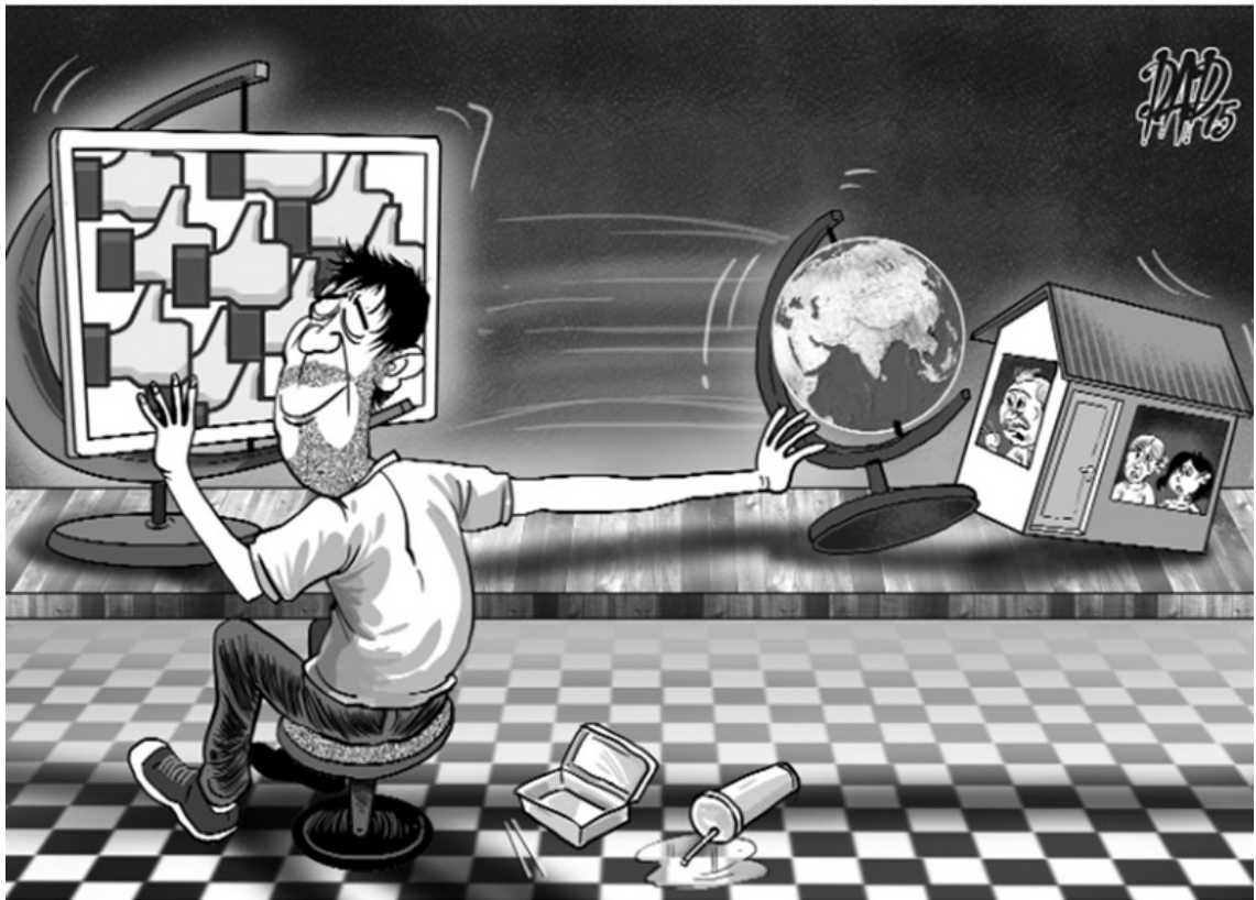
Hình minh họa "bệnh sống ảo".

“Trí tuệ Bát-nhã bao hàm tất cả tri thức học vấn thế gian và xuất thế gian” [xi]. Điều đó cho thấy công nghệ tự thân không xấu; vấn đề nằm ở cách con người tiếp cận và vận dụng. Tỉnh thức trước thế giới số là biết dùng công nghệ để học tập, phát triển bản thân, thay vì để bản thân bị công nghệ điều khiển.