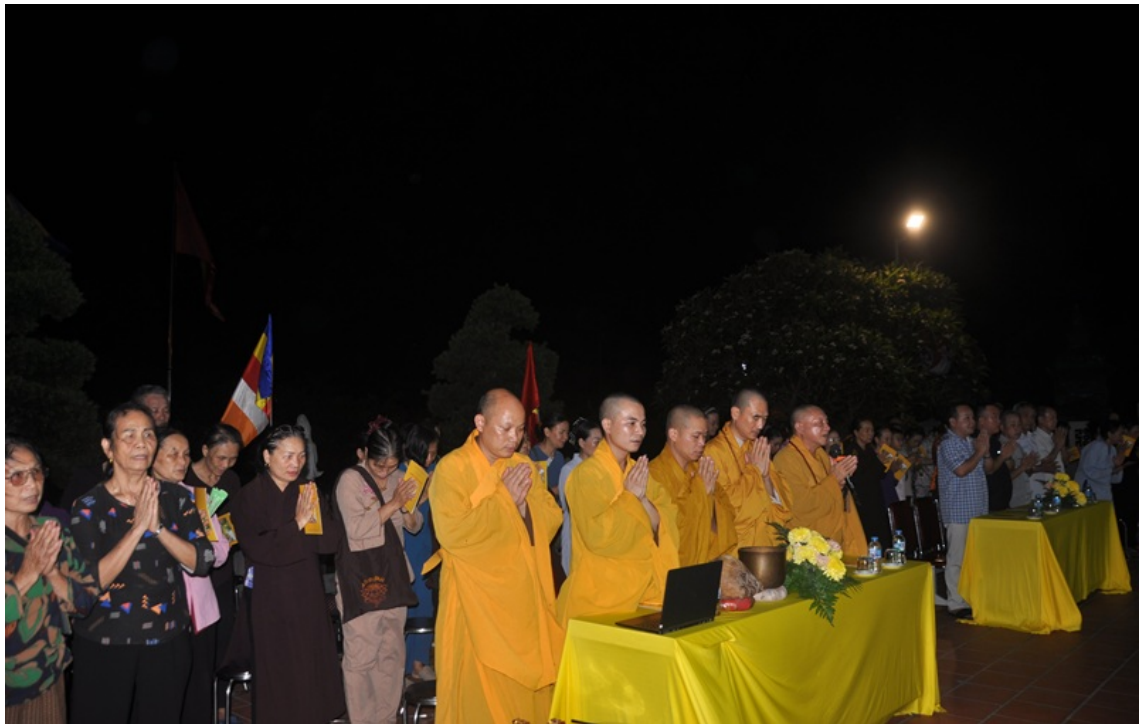
Niệm Phật cầu gia bị

Đại lễ năm nay diễn ra trong bối cảnh đặc biệt khi toàn thể tăng ni, Phật tử cả nước hân hoan đón mừng Phật đản PL.2570 - DL.2026, đồng thời hướng tới dấu mốc 45 năm thành lập Giáo hội Phật giáo Việt Nam . Hòa cùng niềm vui chung toàn dân tộc qua các sự kiện trọng đại như Quốc lễ Giỗ Tổ Hùng Vương và kỷ niệm 136 năm Ngày sinh Chủ tịch Hồ Chí Minh, Đại lễ Phật đản tại chùa Linh Thông càng thêm ý nghĩa, thể hiện tinh thần đồng hành cùng dân tộc của Phật giáo Việt Nam .