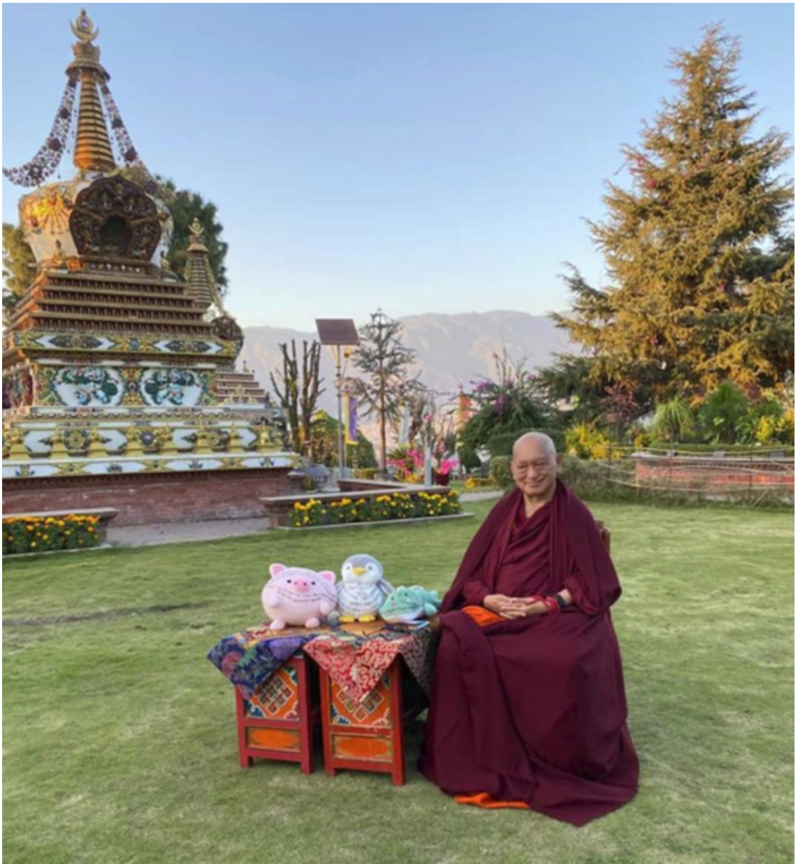
Ảnh sưu tầm