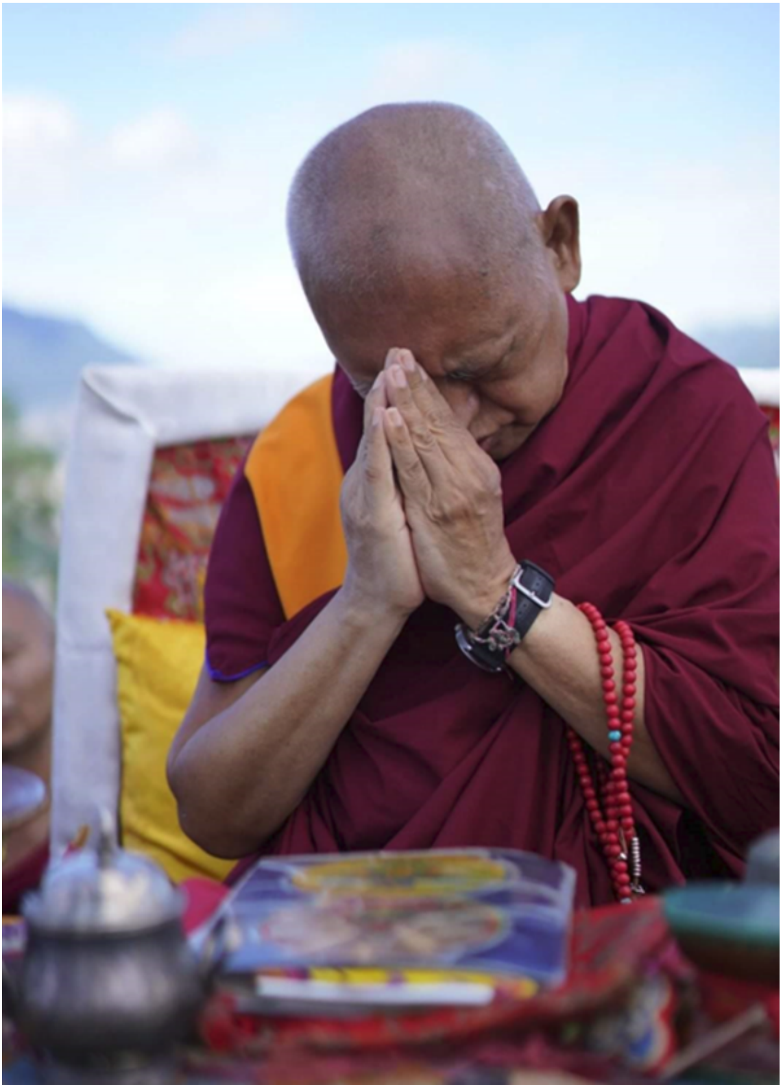
Ảnh sưu tầm