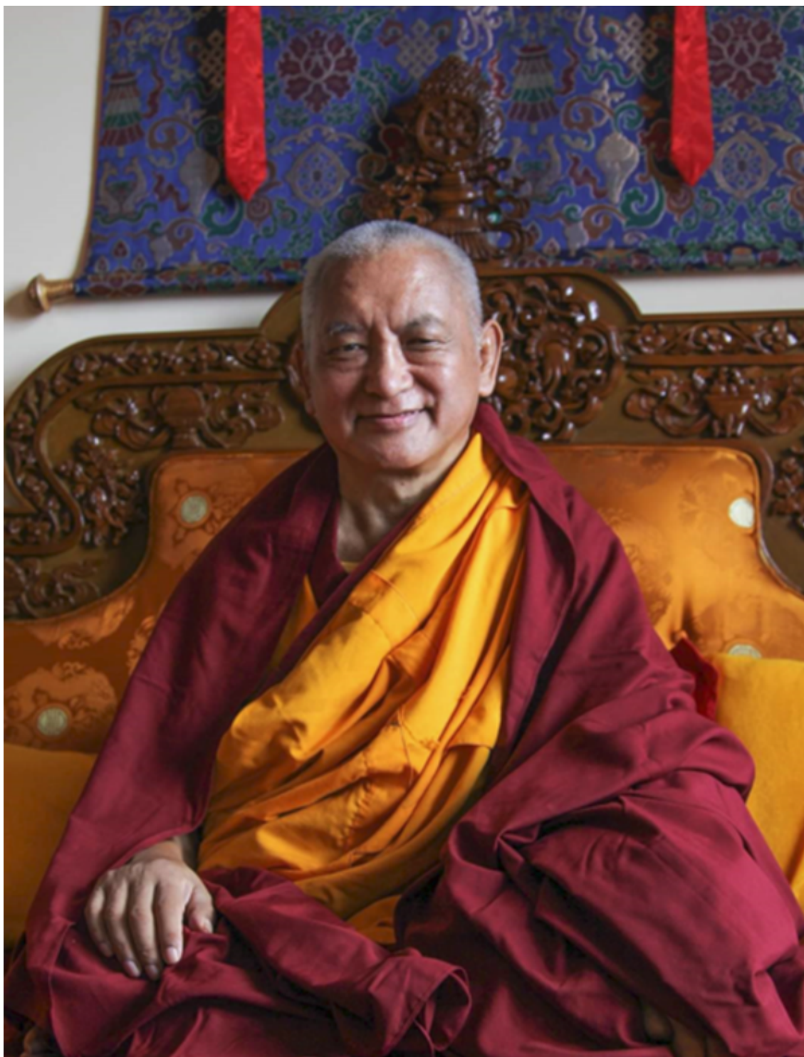
Ảnh sư tâm

Khi bậc Thầy đưa ra lời khuyên dạy, thì có nghĩa đó là hiện thân lời của tất cả chư Phật, và khi bậc Thầy truyền trao giáo pháp thì đó là hiện thân “ thiện hạnh của tất cả ” chư Phật. Người đệ tử phải luôn luôn suy nghĩ theo cách đó và tôn kính bậc Thầy theo cách đó. Khi ấy, không chỉ bậc Thầy mà mỗi hạt bụi trên thân linh thiêng, thậm chí “ một đầu lông, đều hiện vô số chư Phật ”. Khi phụng sự các bậc Thầy với trí tuệ như vậy, thì đó là phụng sự bất khả tư nghì và sự tịnh hóa bất khả tư nghì. Điều này không phải chỉ diễn ra trong vài ngày khi bậc Thầy cho thấy ngài không hoan hỷ thì tâm đệ tử lại phiền não, còn khi bậc Thầy