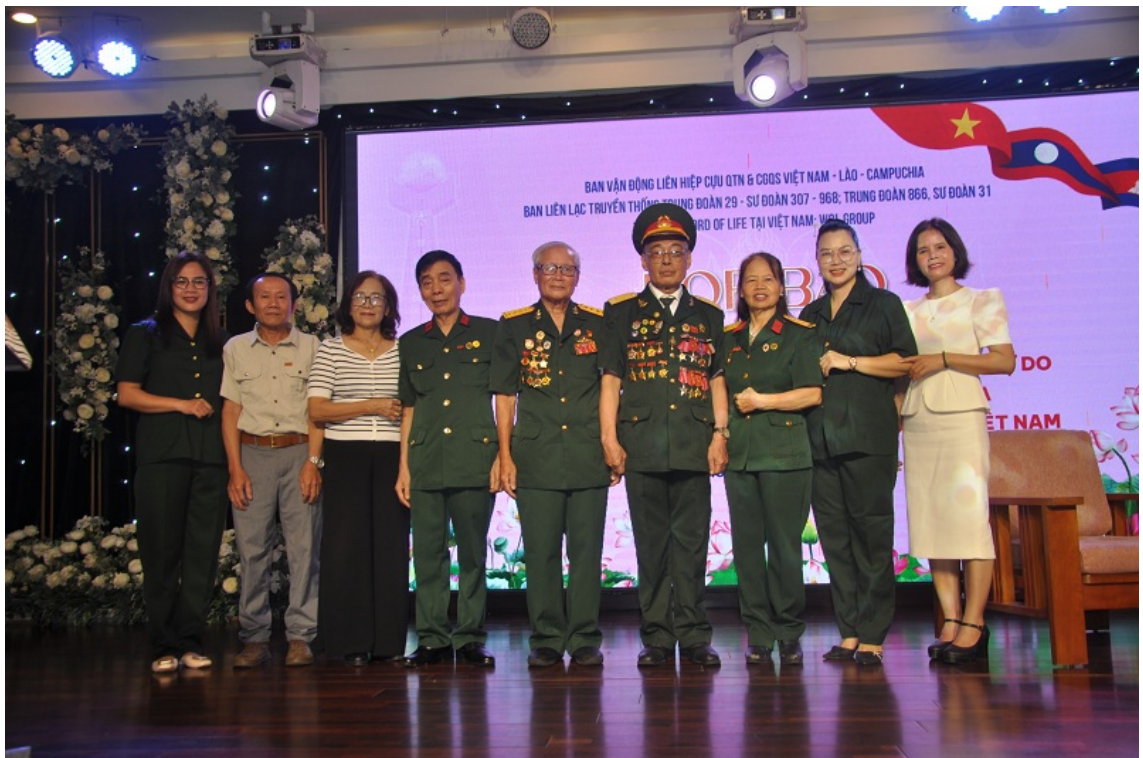
Hình ảnh tại buổi họp báo ngày 16/07

Chương trình không chỉ là dịp để tưởng niệm, mà còn là cơ hội giáo dục đạo lý “uống nước nhớ nguồn”, nhất là cho thế hệ trẻ, những người đang sống trong thời bình, nhưng không được quên cái giá của hòa bình.