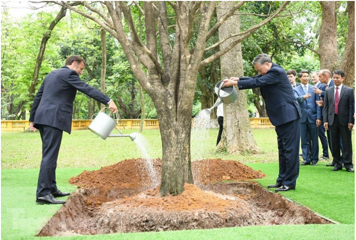
Tổng Bí thư Tô Lâm cùng Tổng thống Emmanuel Macron tưới nước cho cây.

Cây hữu nghị ấy rồi sẽ lớn lên, như một lời nhắc nhở nhẹ nhàng rằng: “Muốn có quả an lạc, phải gieo từ nhân hòa ái”.