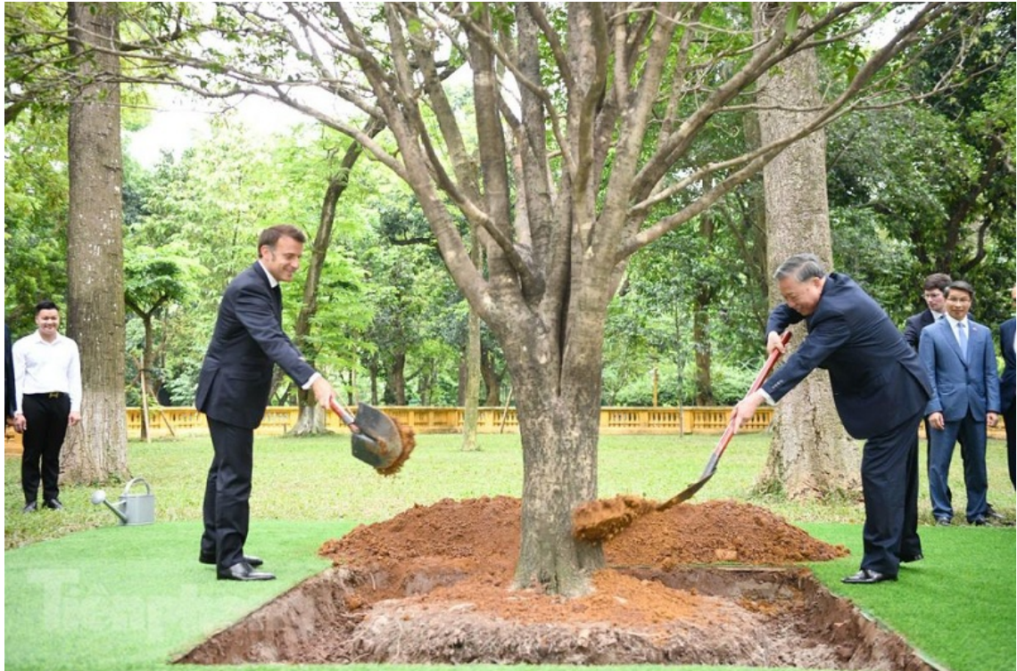
Tổng Bí thư Tô Lâm cùng Tổng thống Emmanuel Macron trồng cây một trong Khu Di tích Chủ tịch Hồ Chí Minh (chiều ngày 26/05).