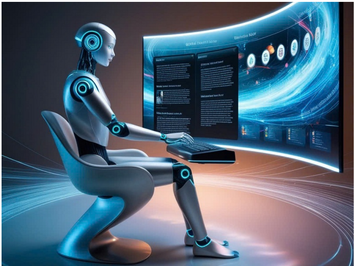
Hình ảnh minh họa được tạo bởi công nghệ AI.

The Associated Press (AP) sử dụng AI để sản xuất báo cáo tài chính doanh nghiệp, giúp giảm bớt khối lượng công việc lặp đi lặp lại của các phóng viên. Điều này giúp họ tập trung hơn vào các bài viết phân tích chuyên sâu.