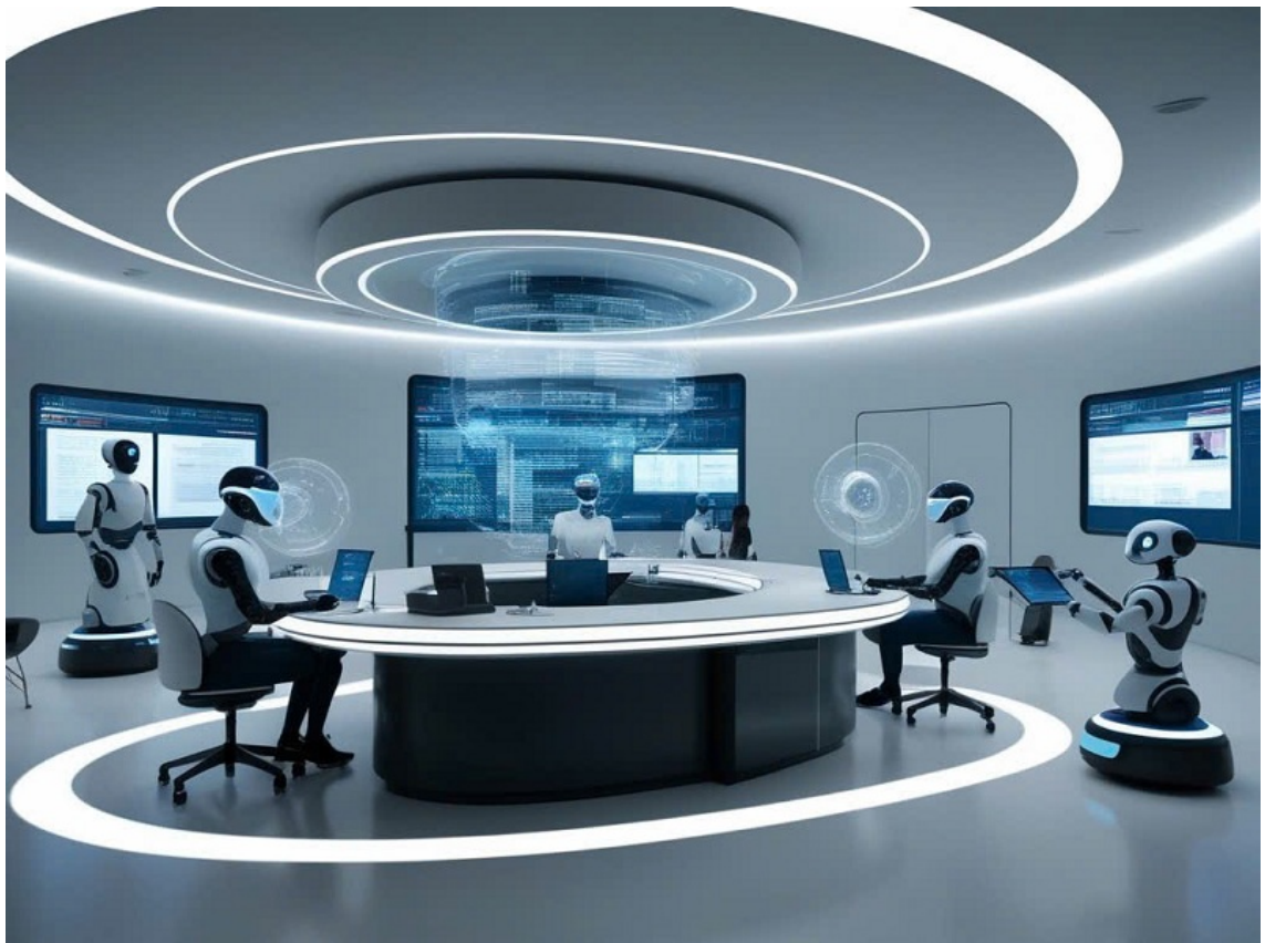
Hình ảnh được tạo bởi công nghệ AI.

AI tự học liệu có thể thấm nhuần tinh thần Phật giáo?