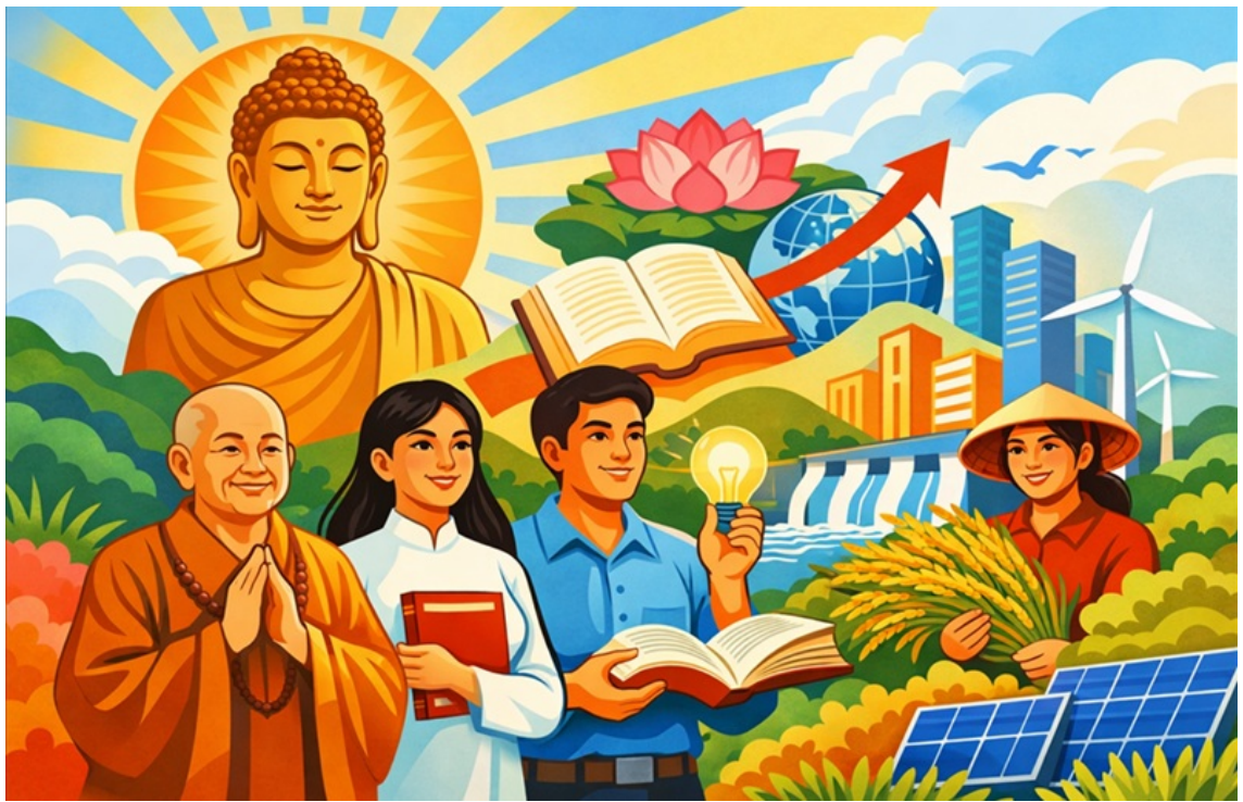
Hình chỉ mang tính minh họa.

Tuy nhiên, sự biến đổi đó không diễn ra một cách tự phát, mà cần được định hướng bởi một hệ giá trị cốt lõi mang tính nền tảng nhằm góp phần nâng cao năng lực cạnh tranh quốc gia, xây dựng môi trường kinh doanh minh bạch, chính trực, định hướng doanh nghiệp phát triển bền vững và có trách nhiệm xã hội. Ngày 21/03/2026 tại Diễn đàn Quốc gia “Văn hóa với Doanh nghiệp”, Bộ giá trị văn hóa kinh doanh Việt Nam đã được công bố. Bộ giá trị này được xây dựng trên triết lý “dân vi bản - lấy nhân dân làm gốc”, đồng thời thể hiện rõ thông điệp hành động “Chính phủ kiến tạo - Doanh nghiệp hành động - Văn hóa dẫn dắt”; qua đó, khẳng định vai trò trung tâm của văn hóa như một động lực nội sinh đối với sự phát triển bền vững. Bộ giá trị này gồm 12 giá trị cốt lõi: yêu nước, tín nghĩa, phụng sự, bản sắc, liêm chính, tự chủ, trí tuệ, sáng tạo; khát vọng, hội nhập, hợp tác, bền vững. Có thể phân chia Bộ giá trị văn hóa kinh doanh Việt Nam theo các nhóm cơ bản sau: