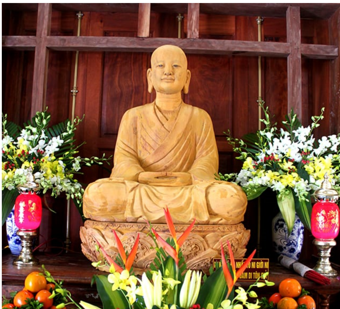
Thiền sư Pháp Loa là môn đệ của Phật hoàng

Căn cứ vào Tam Tổ thực lục , Tam Tổ hành trạng , Thiền tông bản hạnh , Thánh đăng lục ...thì quá trình hình thành và phát triển Phật giáo Trúc Lâm có một bề dày lịch sử đáng kể.